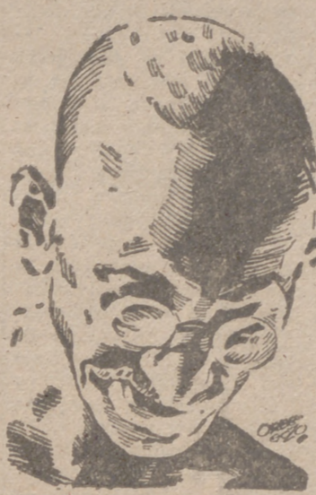
Gandhi, de quien anuncian las agencias periodísticas que se encuentra enfermo de gravedad.

Nueva York, 2.—El presidente Roosevelt ha declarado a los periodistas que Estados Unidos enviarán modernísimo material bélico al ejército de 250 mil hombres del general Giraud.—Efe.