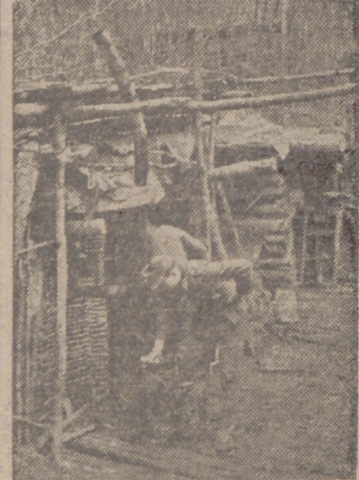
He aquí un curioso refugio de soldados alemanes en un sector del frente oriental. La chimenea está hecha con botas vacías, pues allí se aprovechan todos los restos de materiales que encuentran