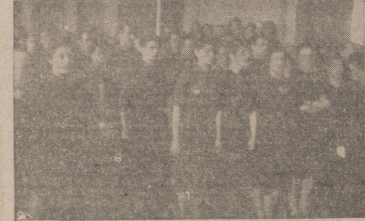
Un grupo de camisetas viejas palentinas en el acto de recibir la Medalla