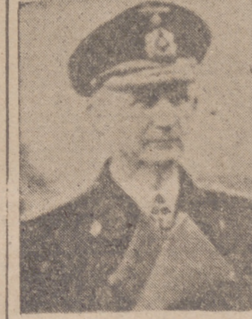
DOENITZ, a quien Hitler ha nombrado recientemente gran almirante