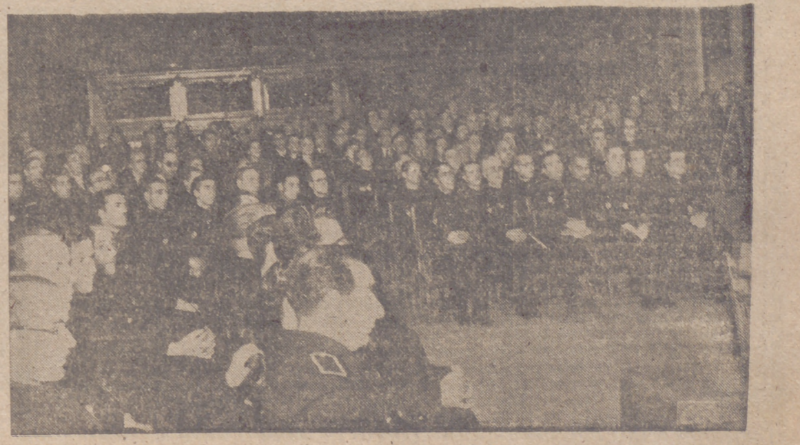
Con asistencia del ministro de Educación Nacional se inaugura el I Consejo Nacional del SEM