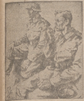
Gran Cuartel General del Führer, 2.—Comunicado del Alto Mando de las fuerzas armadas alemanas: "En Stalingrado, el enemigo ha reanudado el ataque contra el último reducto de los defensores de la fábrica de

En Stalingrado ha sido roto el círculo de defensa del undécimo Ejército alemán