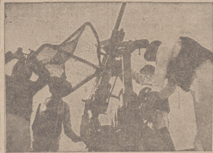
Alarma en la artillería antiséptica de bordo. Con los nervios en tensión espera la tripulación de marinos de este barco alemán recibir la orden de hacer fuego.