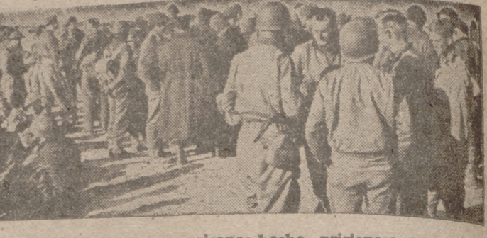
Soldados ingleses y americanos hechos prisioneros por los alemanes durante los combates en la región de Túnez.