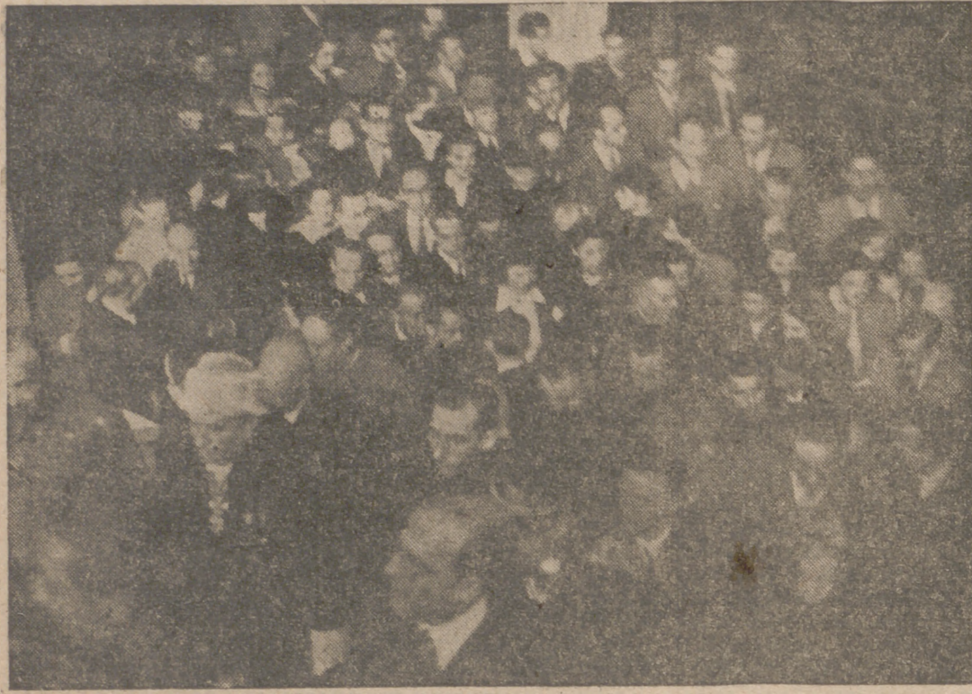
Momento en que las autoridades académicas y el público penetran en la Universidad.

Con la solemnidad tradicional se celebró en la mañana de ayer el acto de la inauguración del curso académico 1942-43. Después de las vacaciones estivales la gloriosa Universidad vallisoletana abre de nuevo sus puertas para seguir su labor formativa de las juventudes universitarias, a quienes el futuro reserva los puestos de dirección y de mando del Estado.