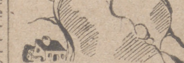
SIN DIRECCION Por ITO

Sobria y potente retema en nuestras aulas hoy, día primero del curso que empieza, la Orden escrita en la que se señala el orgullo de mando de la Milicia Universitaria por el excelente ejemplo de disciplinado servicio que en todo momento han demostrado nuestros camaradas.