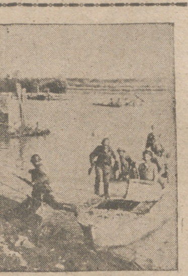
Soldados rumanos cruzan en barcas el Kuban. Al fondo se ven los restos del puente destruido por los rusos en la huida.