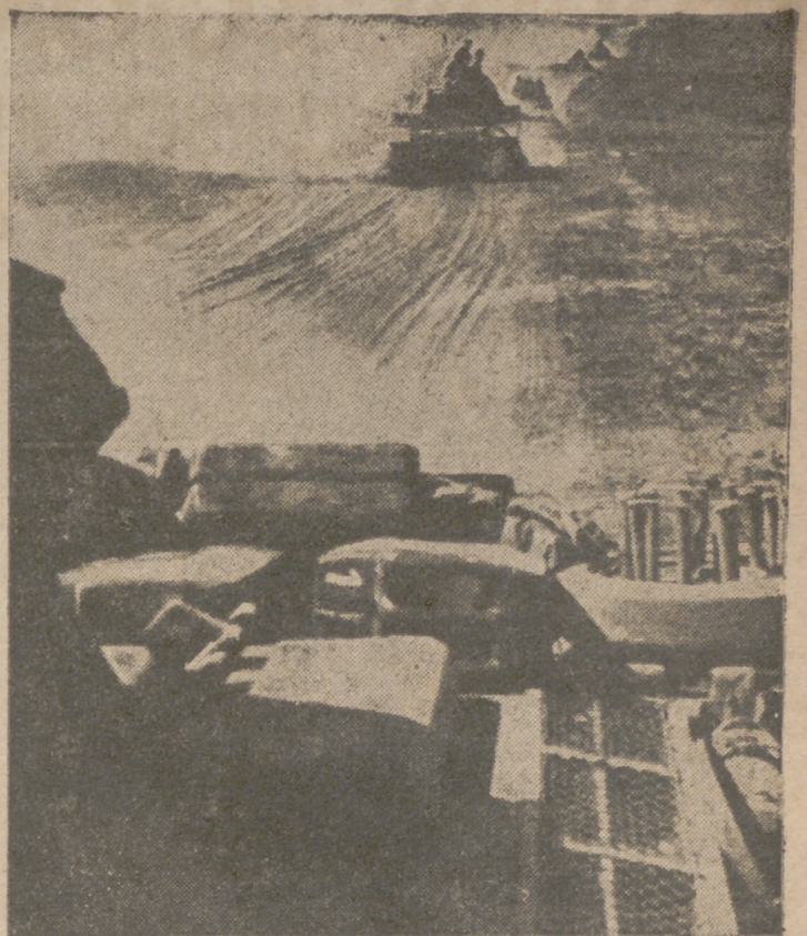
En el sector de Stalingrado. Mientras se libran luchas encarnizadas en las calles de Stalingrado, llegan por las carreteras del exterior más y más tanques alemanes para sustituir a sus camaradas combatientes

Estambul, 29.—El Gobierno turco ha decidido tener representación oficial en la próxima feria de Breslau (Alemania).—Efe.