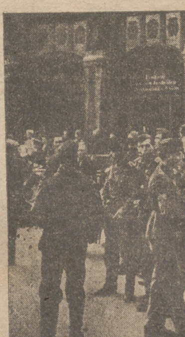
La Organización Exterior del Partido Nacionalista se preocupa de proporcionar a los soldados que luchan al lado de Alemania esparcimiento. He aquí un grupo de camaradas de la División Azul esperando la entrada a un salón de espectáculos

Después de dar una vuelta por la ciudad, la procesión se deshace y el príncipe de Garba, despojado de los rebrimbantes arcos, vuelve a tomar sus pieles de iguana y boa, sus collares, pulseras y colmillos labrados de marfil, y sus figuras de ébano, para seguir sorprendiendo a los incautos europeos recién llegados a la colonia, que pagan a cincuenta lo que obtendrían por diez tras hábil regateo con el príncipe mercader.