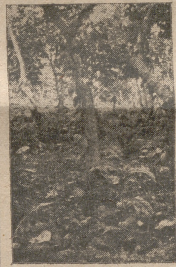
Plantaciones de Fernando Poo

En la actualidad, de tal bosque apenas quedan dos centenares de árboles gigantes, que cobijan los pocos animales que el cazador indígena y mi escopeta aún no han alcanzado. Hoy, de nuevo vamos al bosque precedidos por dos braceros indígenas, sin los cuales me pasaría un siglo debajo de los árboles para no lograr nada, ya que la caza del mono es de las más difíciles por las admirables precauciones con que se esconden. Se me ha dado muchas veces el caso de divisar dos o tres docenas de ellos doscientos metros antes de llegar al bosque, en un árbol determinado, y cuando llegaba bajo él, sin perderlos de vista un momento, los cuadrumanos se habían evaporado. El esconderse lo hacen con verdadera inteligencia, y en los árboles poco frondosos sujetan las ramas junto a sí en tal forma que es imposible ver nada. Queda el recurso de gastar