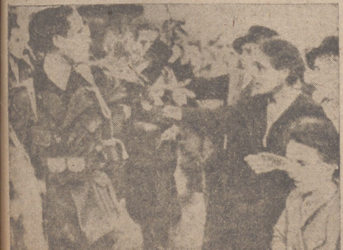
Soldados italianos, al partir para el frente, son obsequiados por la población civil

En combates aéreos librados sobre Stalingrado fueron destruidos 24 aviones rojos. Dos aparatos alemanes no regresaron a su base.—Efe.