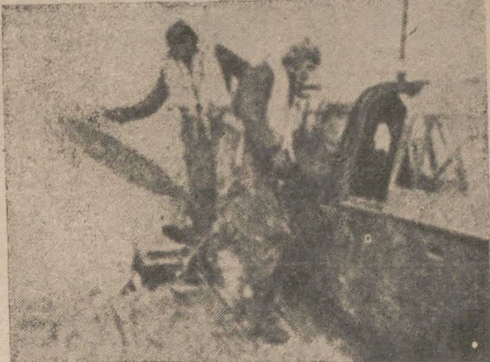
LA RESISTENCIA DE LOS AVIONES ALEMANES.—A pesar de haber recibido este avión alemán, del tipo "Ju-87", un impacto de las baterías antiaéreas enemigas en un lugar bastante delicado, logró llegar nuevamente a su punto de partida.

encargaba de estropear el cacao, cuyas piñas roía cuando comenzaban a madurar, mientras los monos, con miras de juego, se daban a su vez a arrancar las piñas, que luego tiraban al suelo. Contra éstos se luchó con la escopeta y en mi haber tengo un buen número de uñas y otros derribados. A pesar de todo, viendo que los esfuerzos puestos en juego no acababan la cuestión con la rapidez necesaria, mi amigo, de acuerdo con su hermano, participante en la explotación, decidió terminar con el bosque que servía de refugio a los destructores animales.