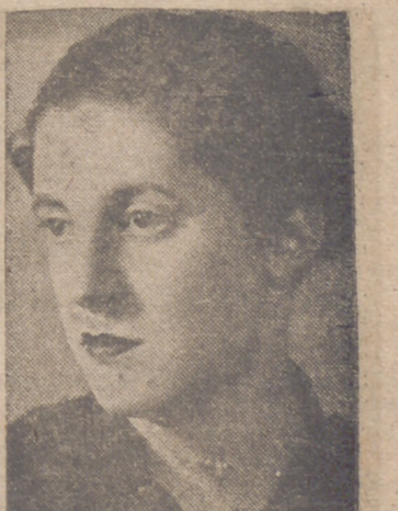
Esta noche saldrán para sus respectivas residencias las camaradas que han asistido al citado curso, y que dirigirán las enseñanzas de los cursillos provinciales, los cuales darán comienzo en toda España el día 4 de septiembre próximo.—Cifra.

Medina del Campo, 31.—La delegada nacional de la Sección Femenina, Pilar Primo de Rivera, ha presidido el acto de clausura del curso nacional de formación de instructoras del Hogar, celebrado en la Escuela Mayor de Mandos "José Antonio", instalada en el Castillo de la Mota. Asistieron además la auxiliar central de Cultura, jefe de la Escuela Nacional de Estudios, delegada local de la Sección Femenina, jefe local del Partido, alcalde, comandante militar de la plaza y varios Padres carmelitas.