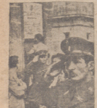
Méjico. Después de anunciar y expuesta la declaración de guerra, una Banda militar toca el himno nacional mientras los oficiales saludan.