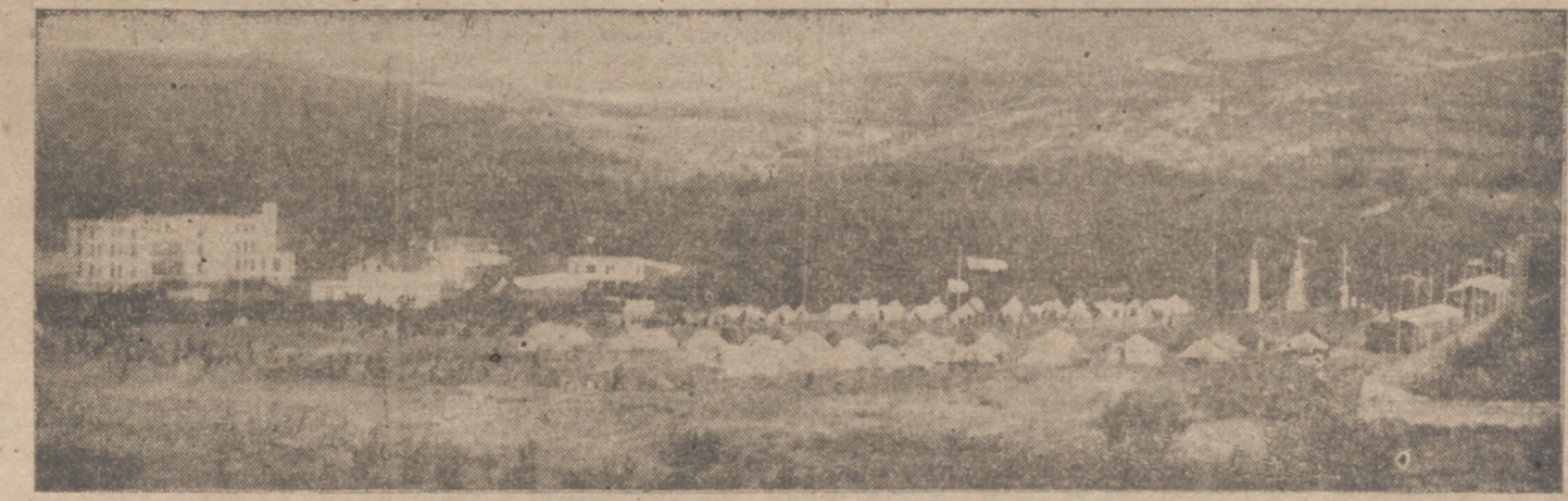
Cien mil camisas azules disfrutarán este año de los Campamentos y Albergues del Frente de Juventudes, instalados en los lugares más bellos de España. La fotografía muestra uno de los magníficos Campamentos, donde la juventud forjará su espíritu y fortalecerá sus miembros, dentro de la disciplina nacional-sindicalista.

Durante cuatro semanas esta flota realizó numerosos ataques contra el tráfico marítimo enemigo y echó a pique tres submarinos soviéticos, dos navios que desplazaban 10.000 toneladas y otras dos unidades.—Efe.