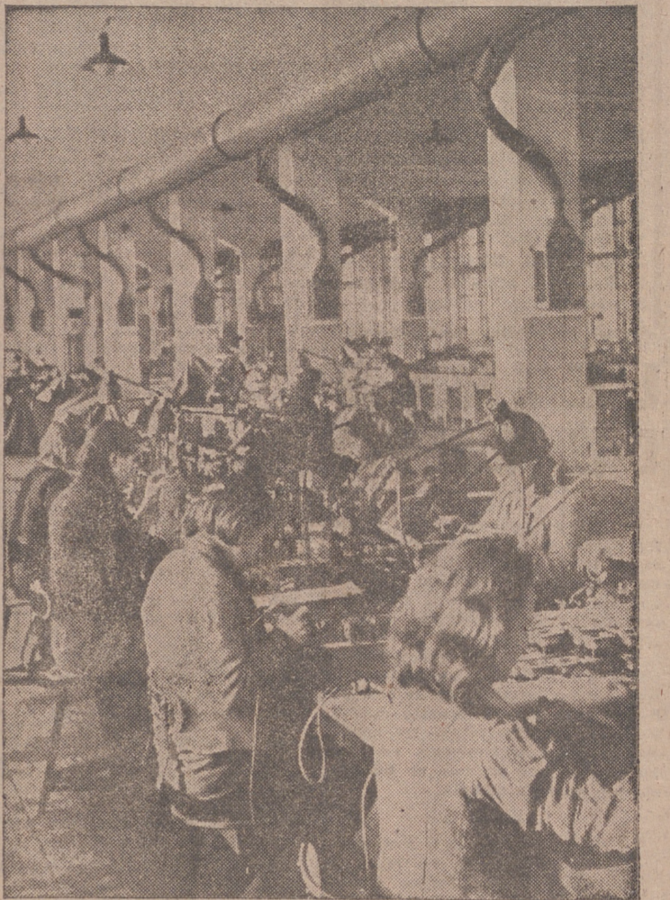
Se vuelve a trabajar en una fábrica de aparatos de radio de la región del Este

Al llegar el tren, la Banda del regimiento de Infantería número 24 interpretó el Himno Nacional, y el público prorrumió (Pasa a la página tercera)