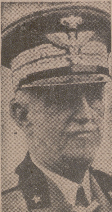
(VÉASE INFORMACIÓN EN LA PAGINA TERCERA)

de persecución y la costa ha sido alcanzada. Las tropas inglesas y sudafricanas que ocupan la posición de Gazala han sido incomunicadas con Tobruk. Divisiones italianas han atacado desde el Oeste y han dominado esta posición. En la tarde de la última jornada han sido conquistados al asalto poderosos fuertes del desierto, al Sur de Tobruk, y se ha ganado terreno en dirección Este. La importancia de esta victoria no puede aún ser considerada en un resumen.