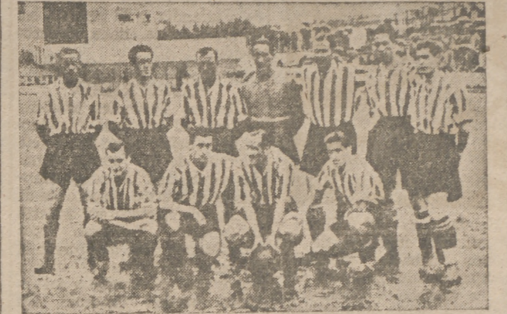
Equipo del Atlético de Bilbao que ayer, en Las Cortes, venció al Real Madrid, deshaciendo el empate existente entre ambos equipos, y que el domingo tendrá que enfrentarse con el Real Valladolid en encuentro correspondiente a la semifinal de Copa del Caudillo

Oviedo sigue en Primera División, después de su victoria sobre el Sabadell (3-1)