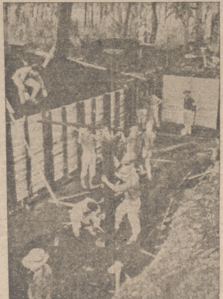
PREPARATIVOS DE DEFENSA. En una isla del Pacífico, soldados americanos trabajan incesantemente en la preparación de defensas contra posibles ataques japoneses.

presala del ataque contra Tokio realizado por los aviones norteamericanos.