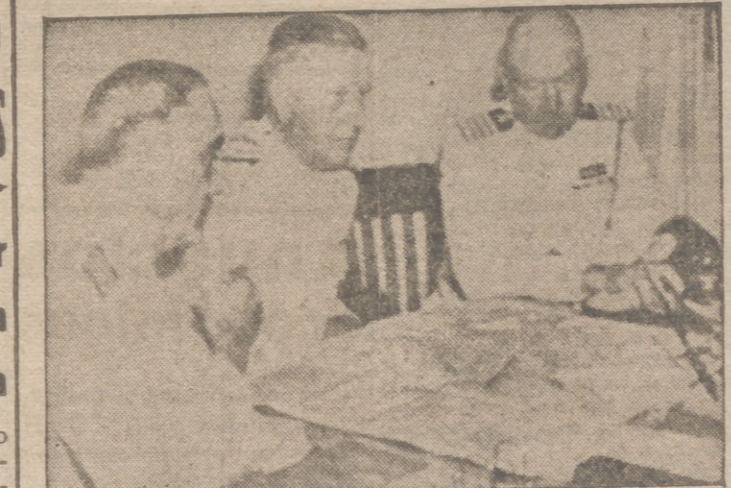
ESTADO MAYOR AMERICANO El almirante H. Kimmel (en el centro), comandante en jefe de la flota de Estados Unidos y comandante de la escuadra del Pacífico, conferencia, alrededor de un mapa, con el capitán W. S. Delaney (izquierda), su jefe de operaciones, y el capitán W. W. Smith, jefe del Estado Mayor

Berlín, 4.—El Alto Mando de las fuerzas armadas alemanas comunica: "Al Sur del frente Este han sido bombardeadas importantes estaciones y líneas ferroviarias bolcheviques. Varias de estas estaciones y numerosos trenes de mercancías fueron destruidos con bombas de grueso calibre. La superioridad