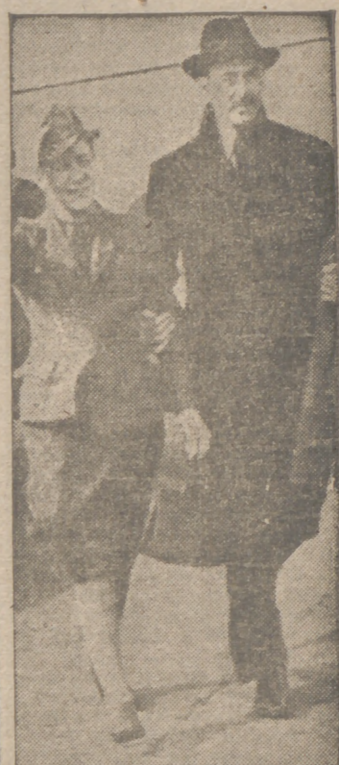
Acompañado de su esposa, Mr. Richard O. Casey, que era ministro de Australia en Washington, llega a Londres para unirse al Gabinete de Guerra como ministro de Estado y representante del Gabinete en el Oriente Central.

Los aviones alemanos han atacado en el mismo sector las posiciones de partida y las localidades ocupadas por la caballería bolchevique. En el curso de estos ataques el enemigo ha experimentado graves pérdidas en hombres y caballos, así como de material. Durante un ataque contra