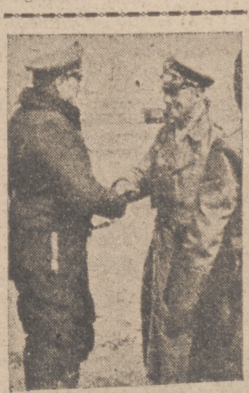
ENTREVISTA en AFRICA El general Rommel, jefe del Cuerpo expedicionario en el Africa del Norte, recibió en su Cuartel General la interesante visita del mariscal de campo de la Aviación alemana, Kesselring. En la fotografía, el general Rommel saludó al mariscal alemán en un aeródromo africano.

que llevar al Gobierno una firme política de colaboración". Ofreció el ministro que recogería con gran cariño y el mayor interés los anhelos y las inquietudes del campo y de la ciudad. El problema del campo—subrayó—está en el Ministerio de Agricultura perfectamente conocido, sentido y vivido. Desde allí conocemos mejor que desde ningún otro sitio el verdadero panorama de España. Al llegar a nosotros vuestras inquietudes, sabremos no sólo sentir, sino resolverlas con cariño y justicia. Afirmó que hay muchos problemas que necesitan un maduro estudio. Cuando tengamos de ahora en adelante,