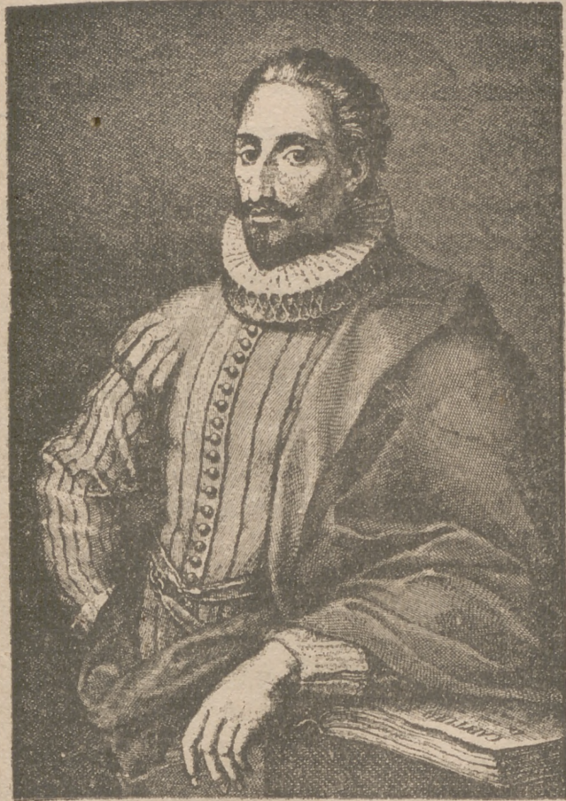
Cervantes, según el grabado de Selma