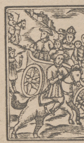
La aventura del Carro de la Muerte (Grabado al boj, Barcelona, 1735)

El relato de las hazañas de un loco y los desvaríos de un pobre hombre de poca sal en la mollera, constituyen la obra que Irving comparó con la Biblia en lo profano; Holland le dió el dictado de la primera novela del mundo; lord Byron dice que ante el placer de leer el QUIJOTE en su propia lengua, desaparecen los demás placeres; Van Effen ve en esa producción el mejor estudio para enseñar la imaginación y cultivar el juicio; Ampere encuentra que es la caricatura más grande que ha producido el ingenio humano; Ríos afirma que es una mutación de "La Iliada"; Díaz de Benjumea dijo que es algo así como un tratado de filosofía alemana, y es obra que el geógrafo anota, el marino comenta, el psicólogo admira y la literatura estudia