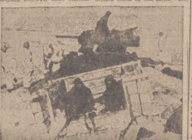
La fotografía muestra un trinchero construido con maderos por los soviets y tirado por un tanque, en el cual se escondían de seis a ocho soldados rusos de infantería, con el propósito de atacar a los alemanes una vez conducidos por el tanque a una posición más avanzada, este intento, aunque bien pensado, fué un fracaso rotundo por parte de los rusos.

Hasta ahora se carece de otros detalles acerca de esta acción.—Efe.