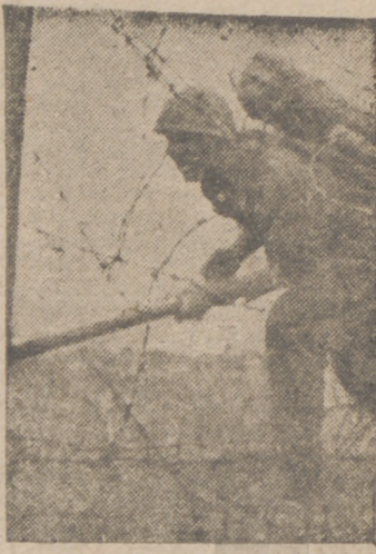
CONTRA RUSIA Como preparación de futuros ataques, este soldado eslavo destruye obstáculos rusos.