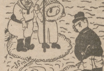
—Estamos seguros de que aquí es donde se ha hundido su señora. —Lo dudo, porque aquí no se le oye, y mi mujer no puede estar un minuto callada. Justino Fraile, 14 años. Valladolid.