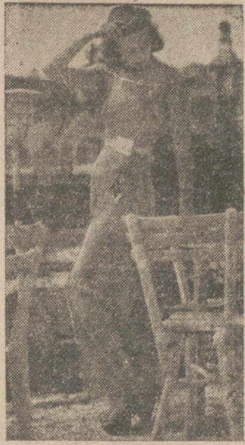
Un lindo conjunto vienes para campo y playa

El otro día pude contemplar en casa de uno de los mejores y más afamados modistos la feminidad encantadora de los vestidos de chaqueta y abrigos de entretiempo, que vienen a desentonar de la sequedad de los abrigos del invierno que acabamos de terminar.