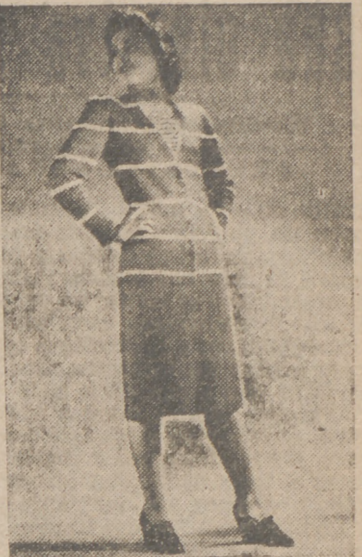
Chaqueta azul a rayas blancas; debajo, jersey a rayas con cuello alto. Chaqueta de un color con tablas figuradas

Se usan éstas ahora de un tono más claro que el que decretaba la moda en el año pasado. En realidad, en este aspecto de la moda cada mujer elige a su gusto. Lo que debe evitarse, por ejemplo, son las uñas de color rojo violado cuando se lleva un traje azul, o las de un tono rojo amarillento con un vestido rosa. Es necesario, en suma, que el barniz de las uñas concuerde con el conjunto de la toaleta.