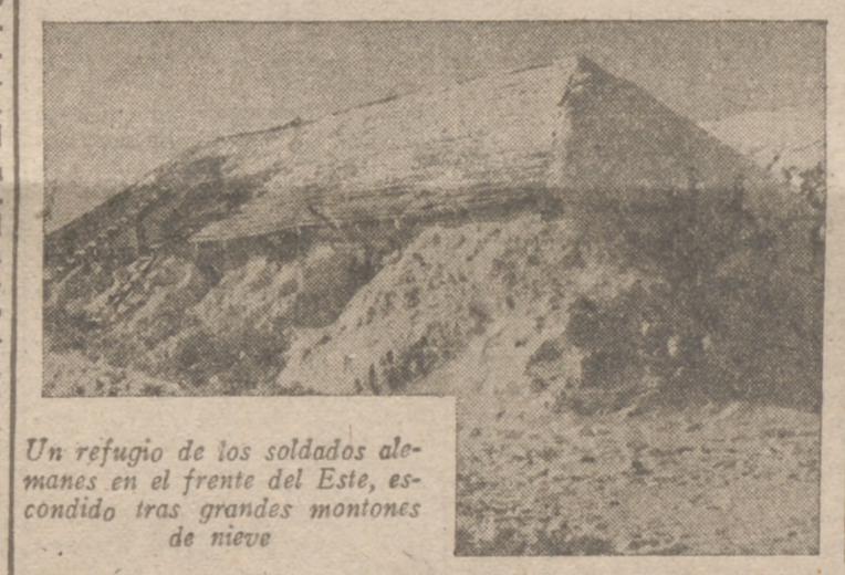
Un refugio de los soldados alemanes en el frente del Este, escondido tras grandes montones de nieve

Tokio, 13.—Se anuncia oficialmente que las tropas japonesas terminaron la ocupación de la península de Bataan el 11 de abril. El teniente general Masaharu Homma ha sido nombrado comandante en jefe de las fuerzas expedicionarias niponas en Filipinas.—Efe.