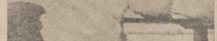
Un observatorio alemán en el frente oriental que permite controlar los movimientos del enemigo