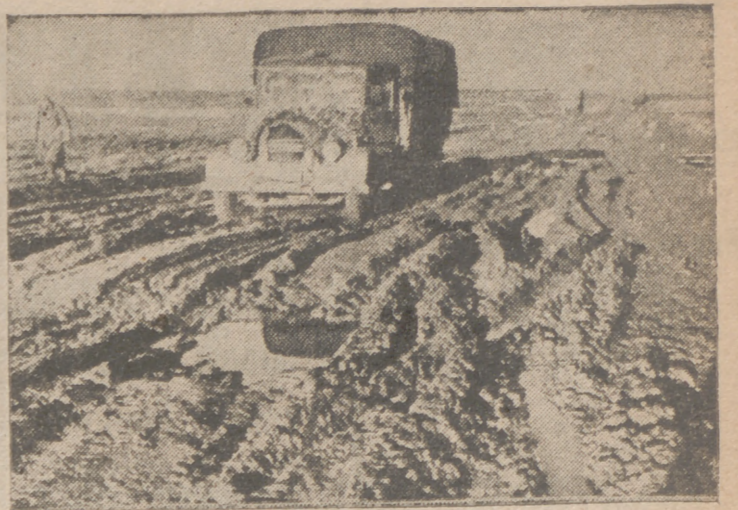
En las partes de Rusia donde la nieve se deshace, las carreteras se transforman en verdaderos pantanos

Aunque ello defraude a las imagnaciones aventureras, en ese orden Lisboa no es más que un placido y confortable lugar de paz, el último de Europa en el que hay la misma vida nocturna de antes de la guerra—cafés y bares abiertos hasta las cinco de la mañana—y a donde en realidad un agente secreto solo puede venir a hacer una cura de reposo de emociones. El periódico de Londres pretendía que Lisboa era aún una "ventana" abierta para que Inglaterra se asome a curiosar el mundo. La expresión es exacta. Pero no es una ventana privativa de nadie, sino neutral, a la que por consiguiente se nos otorga a todos el asomarnos, y correspondiendo a