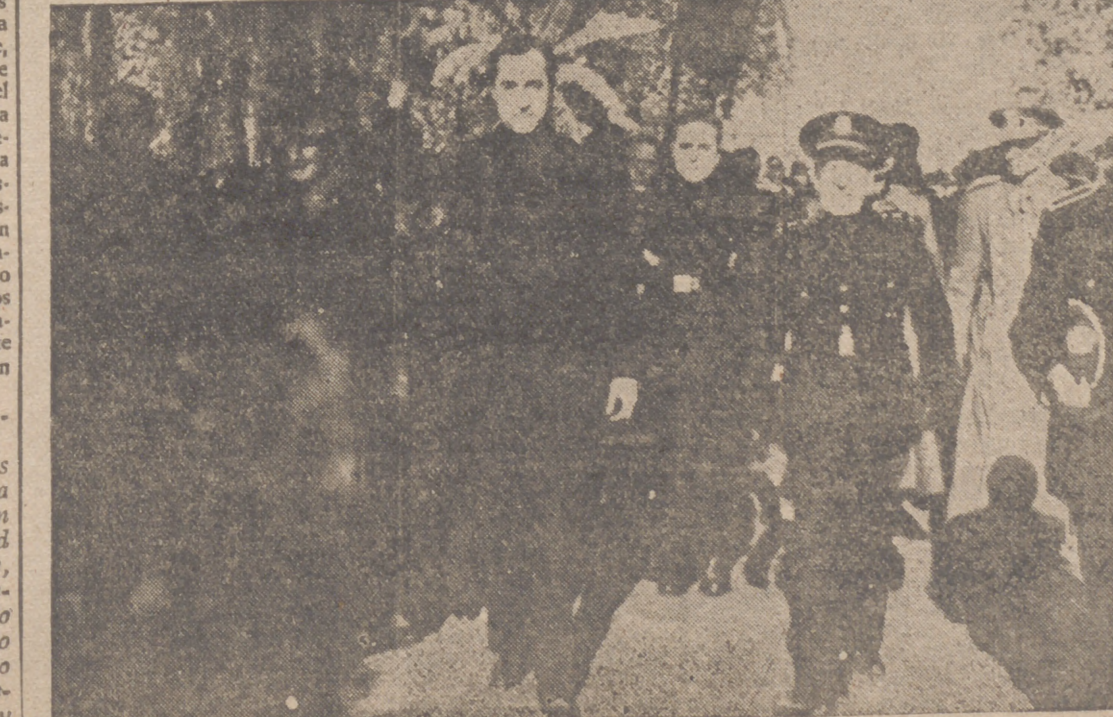
LA CONCENTRACION DE SEVILLA.—El ministro de Agricultura, Miguel Primo de Rivera, llega al lugar del acto acompañado por las autoridades.

Barcelona, 20.—Se ha cumplido el tercer aniversario de la liberación de la provincia de Barcelona por el glorioso Ejército. Con tal motivo todos los pueblos se aprestan a conmemorar la efemérides de su incorporación a la España nacional. En Villafraanca del Panadés y Villanueva y Geltrú se celebrarán mañana actos religiosos y patrióticos, que estarán presididos por las jerarquías del Partido y autoridades civiles y militares. En todas las poblaciones existe gran entusiasmo y ello hace suponer que las solemnes fiestas organizadas revestirán el esplendor de años anteriores.