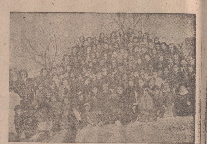
Grupo catequístico. Las mejores niñas de las Delicias, que asisten a la Catequesis parroquial, con las señoritas catequistas, apiñadas en derredor de su muy querido párroco en prueba de filial cariño

Se gratificará a quien la entregue en la calle Núñez de Arce, números 1 y 3, tercero.