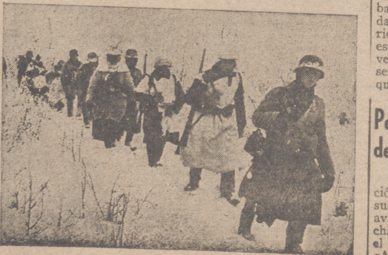
Infantería alemana en camuflaje limpia el campo de batallas bolchevicos.

Con referencia a las operaciones militares, el mismo correspondiente añade después: "Una de las causas de la rapidez del avance japonés por la península estriba en el conocimiento exacto del terreno de lucha. Lo realizado por el Servicio de Información japonés es superior a cuanto pudiera imaginarse. El empleo de palomas mensajeras ha llegado a un grado de perfección tal que ha tenido resultados providenciales en muchos casos. Los destacamentos ciclistas han sido también de gran utilidad y han sabido sacar el máximo partido de los senderos abiertos en la selva virgen por los hombres y sobre todo por los elefantes. Dos correspondientes de guerra japoneses que se extraviaron en el bosque de Johore, pudieron unirse de nuevo a sus tropas después de seguir durante cincuenta y tres horas las pistas trazadas por los paquidermos en la intrincada jungla.—Efe.