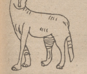
Viente Breaón Ruiz, 8 años. Escuela de Villavieja (Palencia).