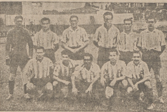
Equipo del Español de Barcelona, que al ser vencido por el Coruña en Sarriá ha perdido sus posibilidades al campeonato