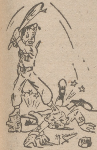
LOS VOLUNTARIOS DE LA DIVISION AZUL JUEGAN A LA BRISCA