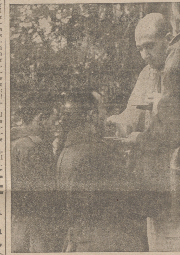
MISA DE CAMPAÑA EN UN CAMPAMENTO DE LA DIVISION AZUL.—Los hechos gloriosos de los valientes voluntarios españoles contra el comunismo van siempre precedidos de la bendición religiosa. La foto nos muestra un momento de una misa para nuestros voluntarios en uno de los frentes rusos.

Londres, 20.—Churchill ha hablado por primera vez en la Cámara de los Comunes, después de su regreso de Washington, y ha declarado, entre otras cosas, lo siguiente: «Comparo, naturalmente, la ansiedad que se experimenta con respecto a la situación en el Extremo Oriente, pero al mismo tiempo tengo gran confianza en el resultado del conflicto». Añadió que dentro de poco se reservarán tres días a debates sobre la marcha de la guerra, y que si las discusiones parlamentarias adquieran el aspecto de un desafío contra el Gobierno, plantearía la cuestión de confianza en el curso de esos debates.—Efe.