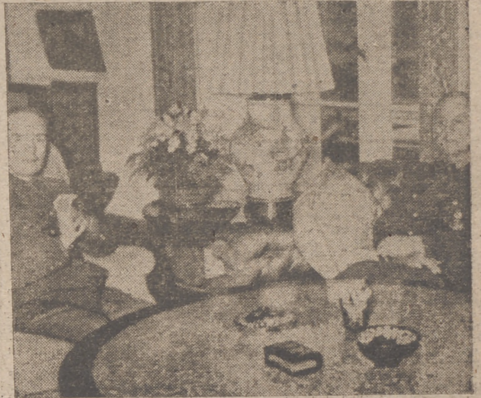
El general Antonescu, jefe del Estado rumano, durante su visita en Berlin, en conversación con el ministro de Asuntos Exteriores, Von Ribbentrop

La próxima conferencia entre Argentina y Uruguay despierta vivo interés