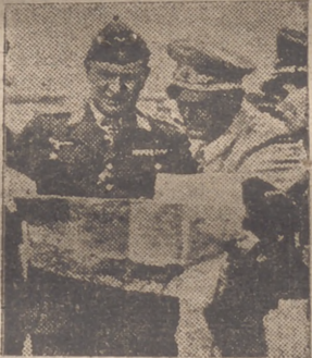
Goering estudia los objetivos de Inglaterra que serán bombardeados.

A los afiliados a la Organización Juvenil se les educará en una conducta que nacirá del sentido de las obligaciones filiales, y adquiriendo así en los peligrosos años de la infancia, el claro sentido de esas virtudes, cuando el tiempo haga de ellos hombres enteros para España, esta tendrá asegurada—dentro de la permanencia de la tradicional vida hogareña española—unos haces de hombres intezros forjados en la mejor de las escuelas: la familia y el hogar.