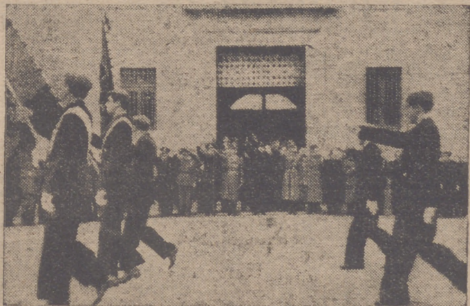
Madrid.—El Reichführer de la S. S., Heinrich Himmler, visita el Monasterio de El Escorial, donde depositó una corona de flores ante la tumba de José Antonio.

Madrid, 23.—El ministro del Ejército ha firmado una orden por la que se dispone que todos los oficiales honoríficos del Cuerpo Jurídico Militar, que no se encuentren prestando servicio en la Asesoría del Ministerio, Consejo Supremo de Justicia Militar, Auditorías de Guerra y Fiscalías Jurídico-militares y que no pertenezcan a los reemplazos actualmente en filas, causen baja como tales oficiales honoríficos y pasen a la situación militar que les corresponda, sin perjuicio de lo que respecto a ellos se disponga cuando quede organizada definitivamente la escala de complemento de las distintas Armas y Cuerpos del Ejército.—Cifra.