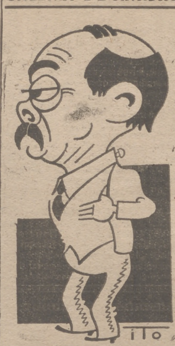
El graciosísimo actor Valeriano León, que con gran éxito actúa en Calderón de la Barca. (Caricatura por ITO)