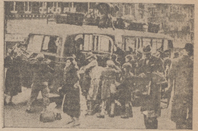
Ante la normalidad de la vía en París y el trato correcto y caballeroso de los vencedores, la población parisina que huyó al aproximarse las tropas alemanas, regresa ahora a sus hogares. Todos los días llegan millares de personas por trenes y autobuses, que ponen fin así a su existencia transhumante.