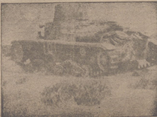
Carro armado italiano avanzando en el desierto de Marmarica.

Cuartel general de las fuerzas armadas italianas, 2.—Comunica. (Pasa a la octava página)