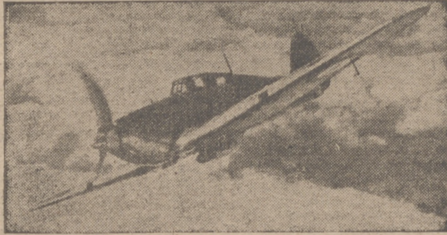
Un avión inglés de observación sobre Londres.

Berlín, 2.—Los aviones de caza alemanes han despegado esta mañana en fuertes formaciones para atacar de nuevo Inglaterra. La alarma aérea se ha dado en Londres poco después de la terminación de la alarma nocturna que duró hasta el alba.—Efe.