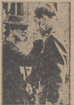
llamada por el rey Miguel, la reina Elena ha llegado a Bucarest. Se han reproducido ya fotografías del aspecto oficial de la recepción; pero he aquí un documento gráfico más humano y conmovedor: la madre acariciando tiernamente al hijo, que la espera en la estación del ferrocarril.