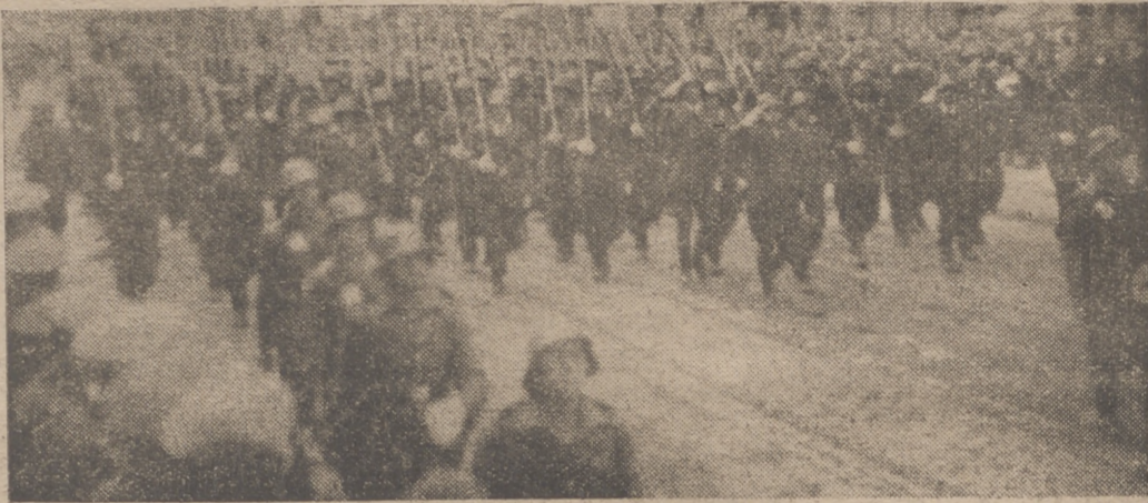
Fuerzas del Ejército pasando ante la tribuna de las autoridades.

Fuerzas de los distintos Cuerpos de guarnición en la Plaza desfilaban ante las autoridades