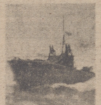
El «Mas», lancha rapidísima alemana que actúa con éxito en el Canal de la Mancha