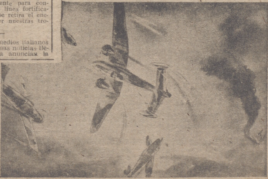
El cielo de Inglaterra es escenario de diarios encuentros como el que se reconstruye en la fotografía