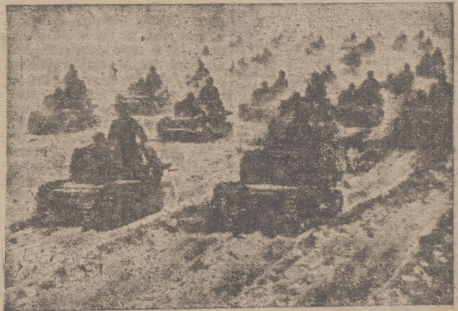
Formación de carros de asalto del ejército italiano de Libia