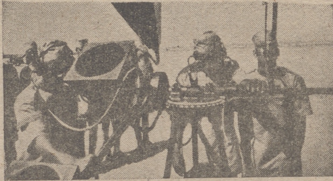
Soldados indígenas del Sudán en un puesto de escucha de la D.C.A.

Hispanoamérica, en vísperas de convertirse en el gran coto de Yanquilandia, se nos antoja un terreno áspero e ingrato, en el que será muy laboriosa la siembra de nuestra doctrina. El señalar la dura realidad no supone una desoladora y pesimista confesión. Si el panamericanismo está en vísperas de ser una realidad—con una falsa interpretación de Monroe—, no es menos cierto que los eternos valores de la raza viven, aunque soterrados, en el Nuevo Mundo, esperando el soplo ardiente de España para informar la vida de un continente en trance de profunda y definitiva separación.