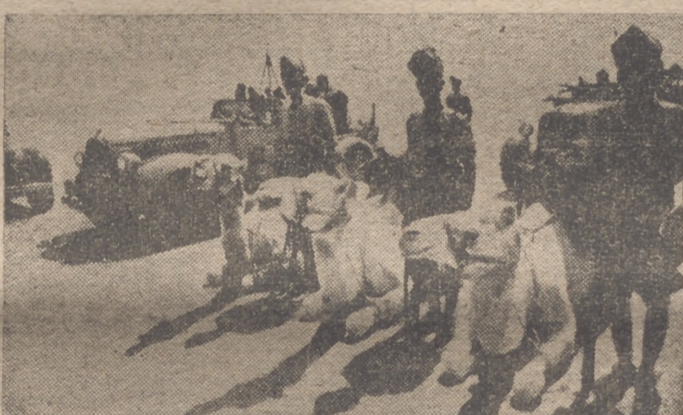
Tropas coloniales italianas de Tripolitania

zas alemanas penetraron hasta las zonas defensivas del enemigo, permitiendo así a las unidades alemanas de bombardeo que alcanzaran sus objetivos. En la noche del 17 de agosto aviones británicos penetraron en territorio alemán y atacaron varias localidades, en las que produjeron daños de escasa importancia. Varias casas fueron alcanzadas por las bombas y resultaron dos personas muertas y varias heridas. Las pérdidas totales del enemigo se elevan en el día de ayer a 89 aviones, de los cuales 59 fueron destruidos en combate aéreo, 23 en el suelo y siete durante la noche por la artillería de la D. C. A. Fueron incendiados