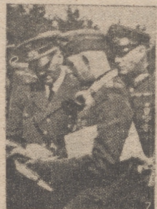
Hitler, en su Cuartel General, recibe las explicaciones detalladas que le da el jefe de una escuadrilla aérea alemana sobre los éxitos alcanzados en uno de los últimos bombardeos de Inglaterra.