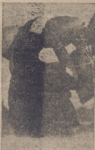
La era es el centro hogareño y de trabajo de los labriegos de España. En ella se desenvuelve la vida toda de nuestros campesinos en estos días de estío. Mientras se trilla la paja y se realizan las distintas faenas propias de la recolección, los labradores combaten el intenso calor veraniego con sabrosos tragos de vino de la tierra y agua fresca del botijo.