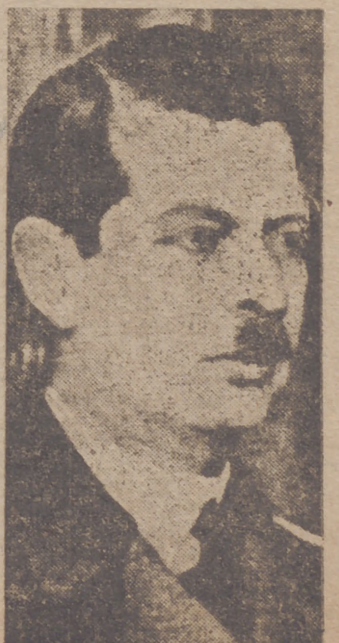
EL REY CAROL

Bucarest, 9.—El ministro de Hungría, Bardsosy, ha entregado