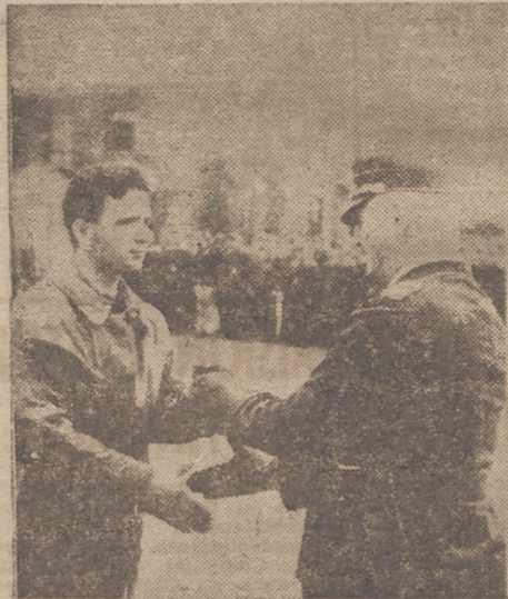
Un alto jefe de la Aviación alemana condecora a un oficial por su heroico comportamiento

to, alto motivo de gloria para un régimen cuya razón de ser consiste en servir el honor, el poder y la grandeza de España. Cerró su discurso con aclamaciones a España y al Caudillo, que fueron contestadas con gran entusiasmo en medio de prolongados aplausos. Al abandonar el Sanatorio el ministro de la Gobernación y sus acompañantes se interpretó el Himno "Cara al sol", y, por último, el camarada Serrano Suñer dió los gritos del Movimiento, a los que toda la concurrencia, brazo en alto, contestó clamorosamente.—Cifra.