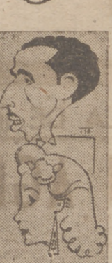
El director de la orquesta que actúa en Calderón, y Consuelito de Málaga