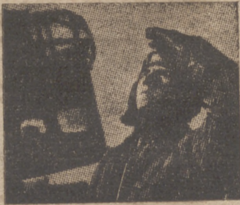
Ante el ruido de motores enemigos, el aviador observa el cielo

Londres, 1.—El Ministerio de la Guerra publica un comunicado, en el que anuncia el regreso de Francia de lord Gort, jefe del Cuerpo expedicionario británico. «En vista de la buena marcha de la evacuación de nuestras tropas—dice—y como consecuencia de haberse reducido el número de fuerzas inglesas que quedan en el Norte de Francia, el general lord Gort, siguiendo órdenes del Gobierno de Su Majestad, ha entregado el mando a un oficial de menor categoría y ha llegado esta mañana a Inglaterra.»—Efe.