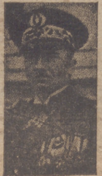
El almirante ABRIAL