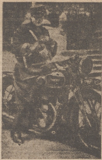
El Cuerpo de la "Local Defence Volunteers" posee enlaces femeninos de tanta belleza y equipo tan perfecto como éste

Madrid, 1.—Ha regresado a Madrid de su viaje a Zaragoza, el ministro de la Gobernación, camarada Ramón Serrano Suñer.—Cifra.