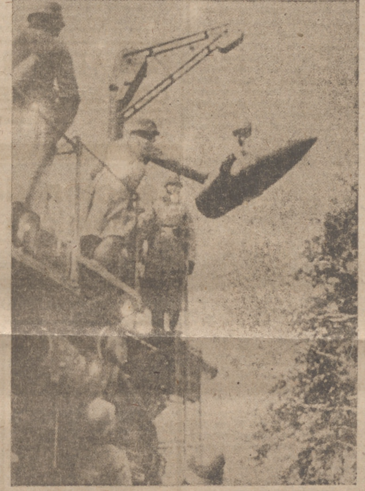
Artillería pesada de Alemania en la línea Sigfrido

Las costas noruegas, aseguradas por la aviación alemana