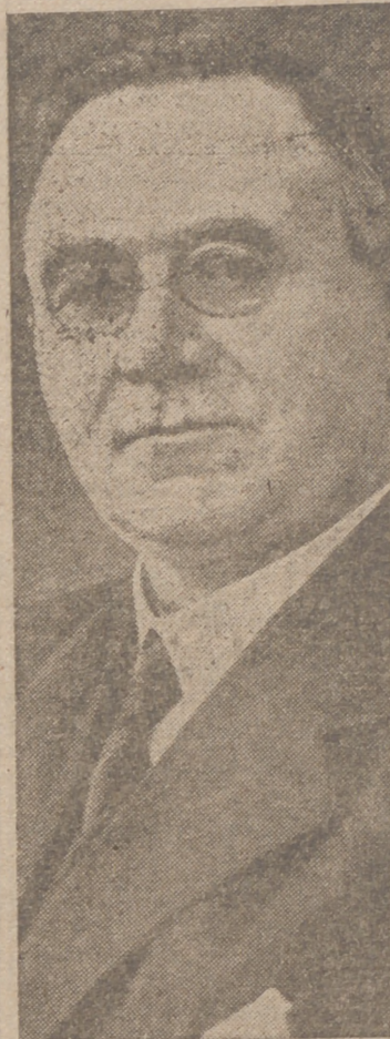
M. NYGARDSVOLD, presidente del Consejo de Noruega, en fuga

El acto concluyó con vivas a las dos naciones, a Franco, a Carmona, a Oliveira Salazar y a las dos Marinas.—Efe.