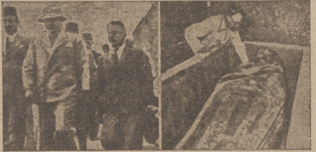
El rey Faruk de Egipto asiste a la apertura del sarcófago del faraón Pomenes, de la XII dinastía. Dos momentos del acto. A la izquierda, el profesor Montet acompaña al rey Faruk que viene a asistir a la apertura. A la derecha, el profesor Montet examina el sarcófago, que es de plata maciza

Añade que la respuesta británica a la nota italiana será extremadamente clara. En ella será puesto de manifiesto que el Gobierno de Londres no pretende obstaculizar la actividad industrial de Italia ni de otros países, y tratará de disminuir las dificultades e inconvenientes que puedan resultar para terceras potencias.—Efe.