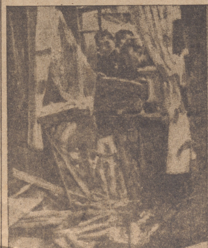
El disparo de una batería costera del Reich al North, hecha al descubrir el periscopio de un submarino que se dirigía a un campo de minas, ha provocado la destrucción de una casa de Leith sobre la que hizo explosión