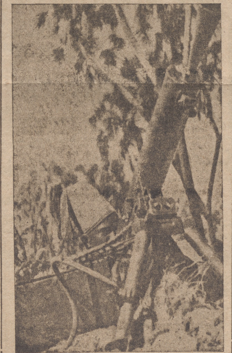
Ejercicios de armas en el Imperio italiano