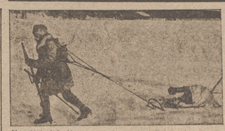
Un soldado finlandés transportando una ametralladora sobre un trineo