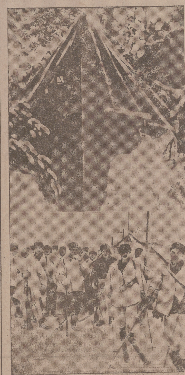
ARRIBA: Puesto de un centinela finlandés en la frontera rusa. ABAJO: Una compañía finlandesa descansa en una villa de Carelia

Langsdorf se suicidó la noche última en el arsenal naval de Buenos Aires, pero su cadáver no ha sido encontrado hasta hoy.—EPE.