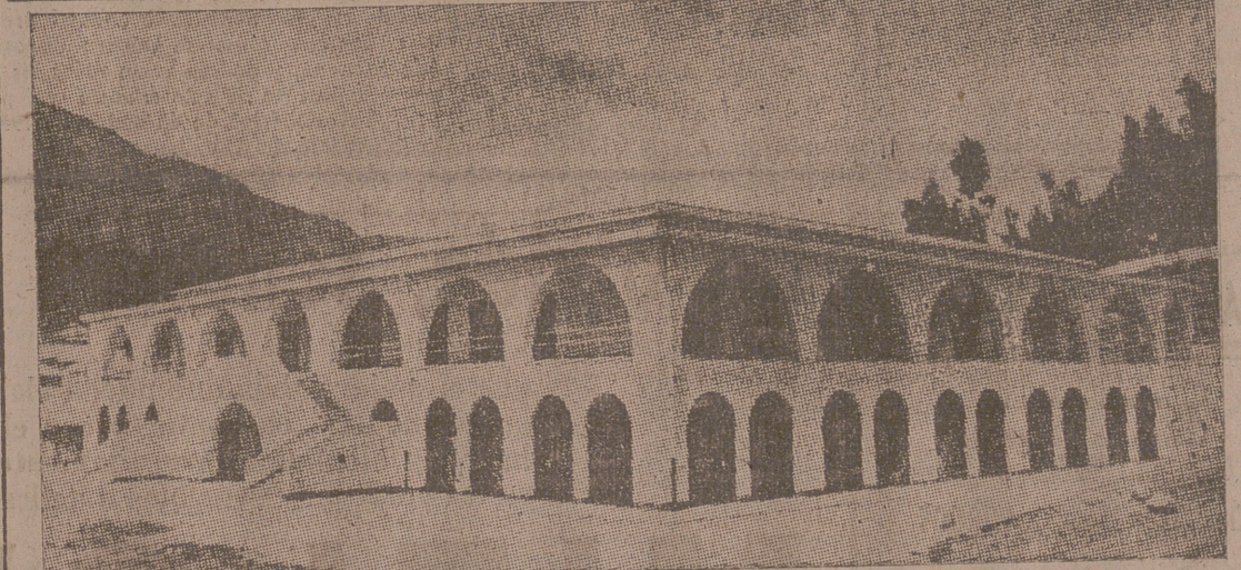
El gran mercado indígena recientemente construido en Dessi, en la plaza denominada del Mughler