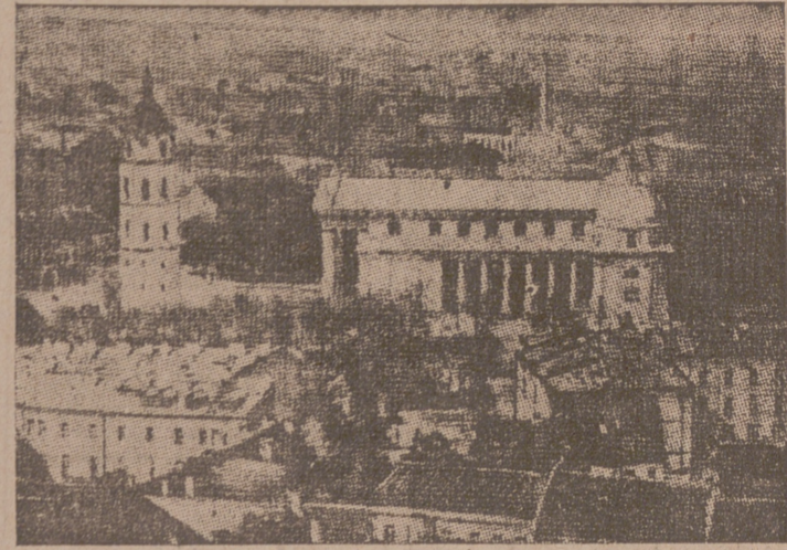
Una vista de Wilna, donde han ocurrido graves desórdenes

París, 26.—En los días 27, 28 y 29 los súbditos de Checoslovaquia residentes en Francia celebrarán la fiesta nacional de su país.—(CSA).