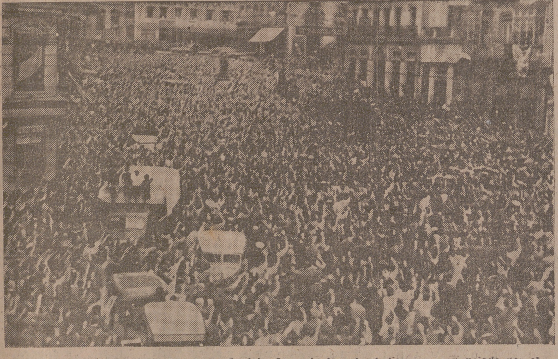
VIGO.—Aspecto que ofrecía la Plaza del Capitán Carrero, durante el discurso pronunciado por el Paudillo

LA COMPAÑIA NACIONAL DE OXIGENO DONA 30.000 PESETAS PARA LA SUSCRIPCION NACIONAL Bilbao, 19.—La Compañía Nacional de Oxígeno ha hecho un donativo de 30.000 pesetas con destino a la suscripción nacional.—Faro.