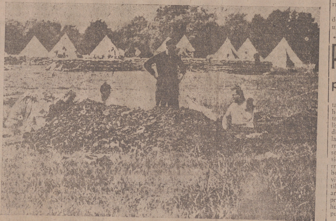
París y Londres se dedican febrilmente a la construcción de refugios anti-aéreos

Esta Legión se pondrá a las órdenes del Ejército polaco, aunque conservará su carácter nacional peculiar. Está mandada por un general checo.