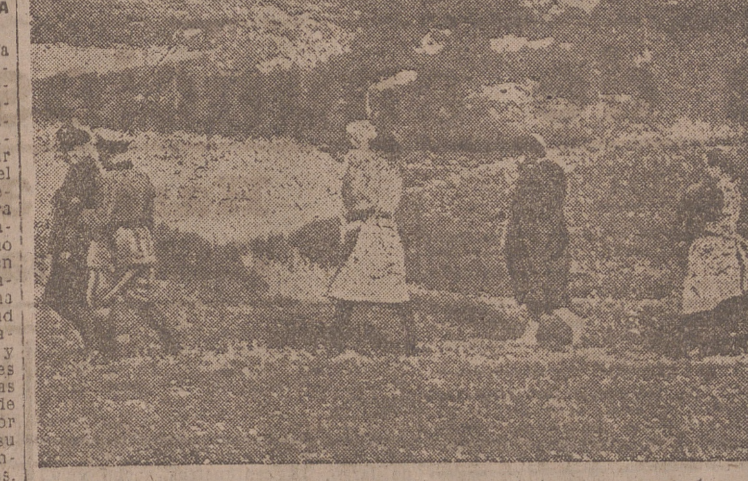
Los alemanes escapados de Polonia son recibidos y acompañados por los aduaneros germanos, que los colman de atenciones

Tercero.—El Gobierno británico ha concedido plena franquicia al Gobierno polaco—hecho único en la Historia—para cualquier acción que Polonia quiera emprender contra Alemania.