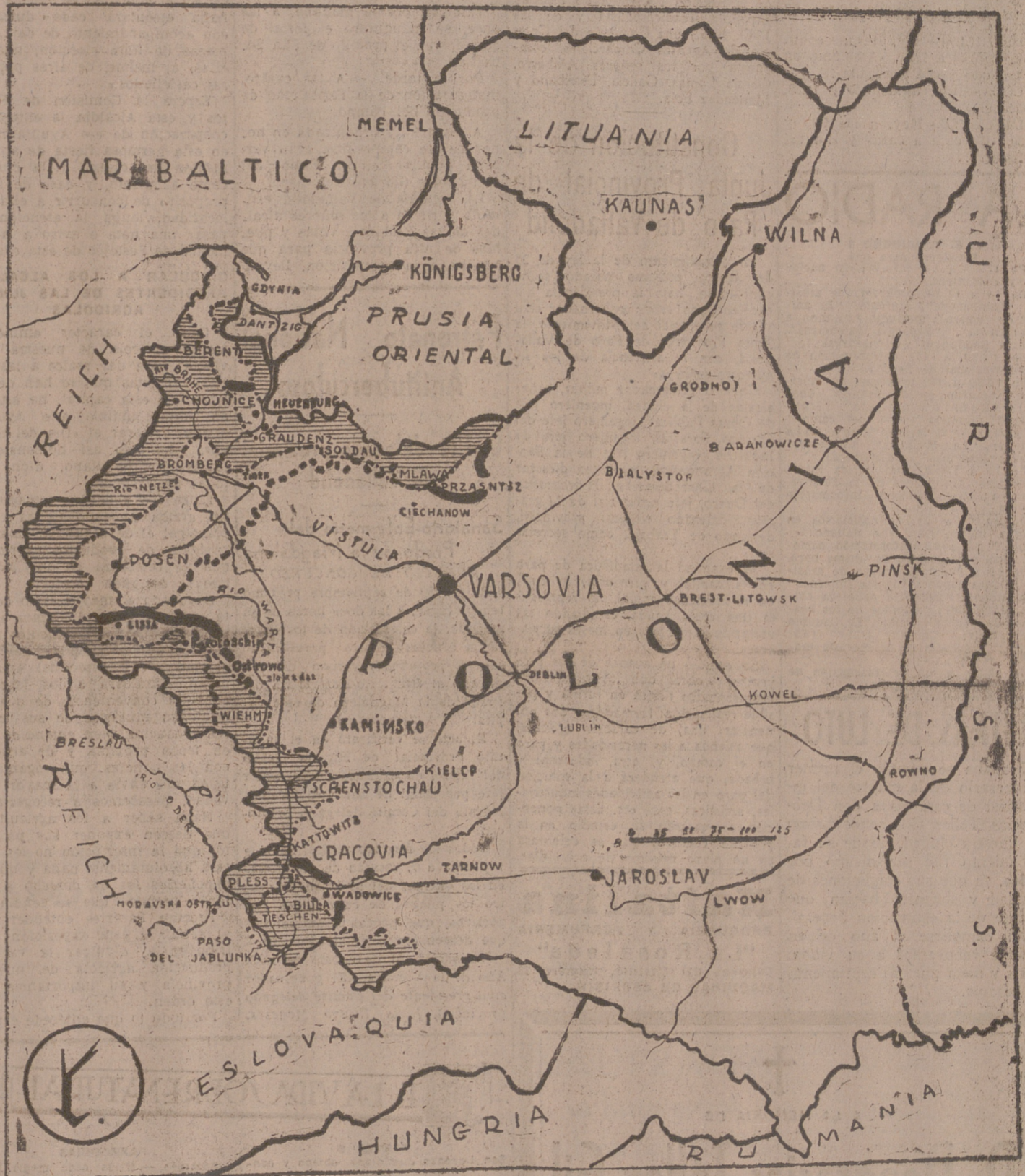
La línea de trazos gruesos indica de trazo y punto expresa la antigua frontera alemana. La línea de trazo y punto expresa la actual y la de gruesos trazos, hasta dónde llegó la progresión en el día de ayer.

El domingo Inglaterra y Francia DECLARARON LA GUERRA A ALEMANIA