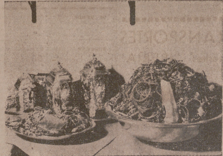
Objetos de oro y plata que, una vez separados de ellos las piedras preciosas, esperan ser fundidos en nuevos lingotes.

Buenos Aires, 25.—Según noticias de La Paz, el Gobierno boliviano ha ordenado que se abra una información de gran amplitud, a fin de esclarecer las causas un poco oscuras de la muerte del presidente de Bolivia.—D.N.B.