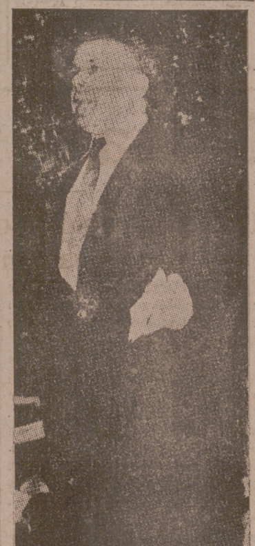
SEAN RUSSEL Jefe del Ejército republicano irlandés, hablando contra Inglaterra en una reunión de Chicago