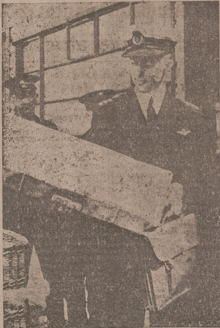
El capitán «Cabot» con la caja de las dos pieles de castor negro, llegadas en el hidroavión de dicho nombre, que según tradición desde el año 1675 la Compañía de peletería de Hudson Bay debe pagar al Rey de Inglaterra