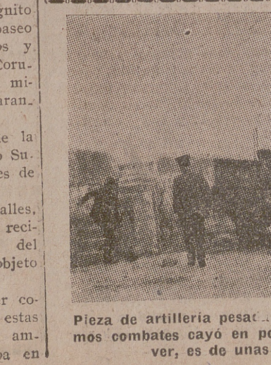
Pieza de artillería pesada del ejército chino, que en los últimos combates cayó en poder de los japoneses. Como se puede ver, es de unas características anticuadas.

LLEGADA A BURGOS Burgos, 19.— Procedente de Sevilla ha llegado a Burgos el ministro de la Gobernación, camarada Serrano Suñer.