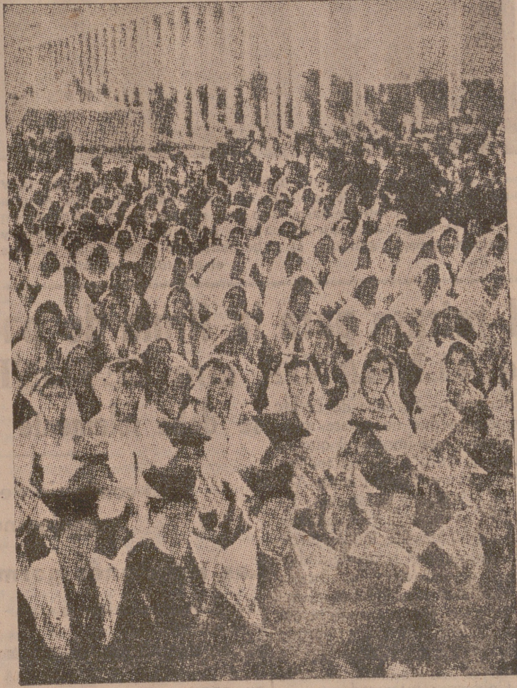
ROMA.—Mujeres fascistas ante el Circo Massimo

Berlín.—Invitado por el ministro del Interior de Hungría ha salido para Budapest el ministro del Interior del Reich.—(CSA).