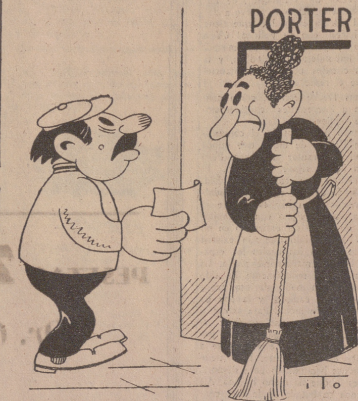
VECINDAD RECOMENDABLE (Por ITO)

—¿Viene a cobrar alguna factura atrasada? —No, señora. —¡Ahí, entonces no vive en esta casa la persona por quien pregunta!