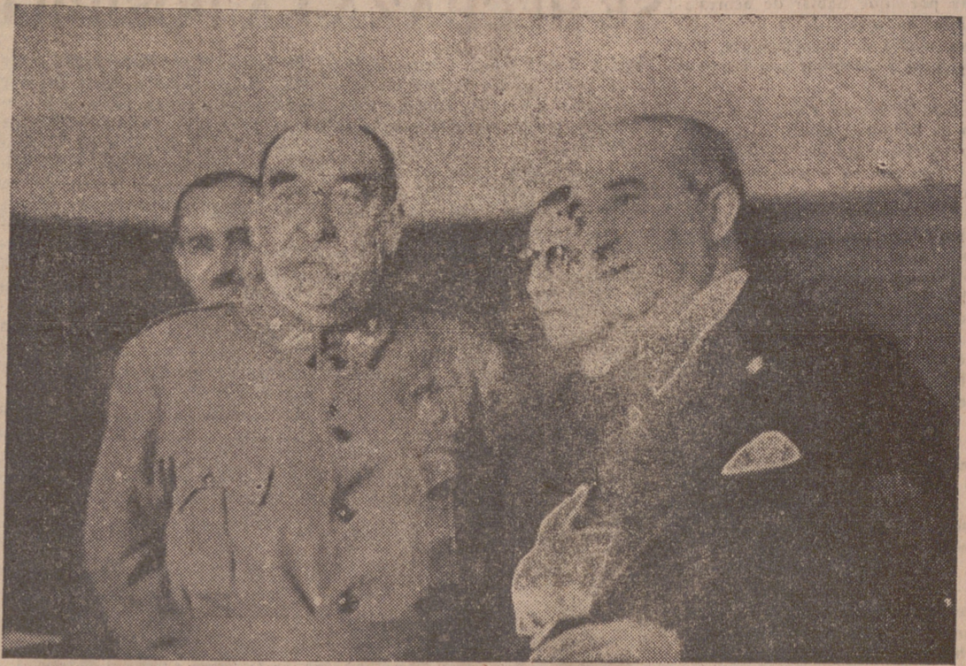
Las autoridades de Madrid habían abandonado la Casa de la Villa, habiendo instalado las dependencias municipales en otro edificio. Ahora, el nuevo Ayuntamiento de Madrid ha decidido volver a su primitiva Casa. Con este motivo se ha celebrado una ceremonia religiosa en la que ofició el Obispo de Madrid-Alcalá y asistieron las autoridades y el Ayuntamiento en pleno.—El teniente general Saliquet, el gobernador civil de Madrid, teniente coronel Alarcón de la Lastra y el alcalde señor Alcocer