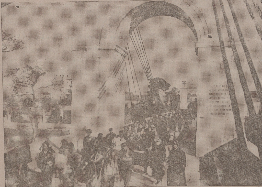
Una caravana interminable de milicianos rojos atraviesa el puente colgante del Boulevard, en la frontera franco-española, para internarse en territorio francés

Un viaje de Barcelona a Gerona, siguiendo costosamente la ruta de la guerra, es uno de los viajes que pueden quedar como de maravilla en los programas excursionistas del turismo. Nosotros hemos salido muy de mañana de Barcelona, cuando sobre la gran ciudad catalana empezaban a abrirse de par en par todas las balconadas, en señal evidente de que el trabajo, aquí, no se hace esperar. Después Badalona, Mataró, Arenys de Mar, Palamós, Caldetas... La gente anda a paso largo por todos los libertos. Hay verdaderos deseos de dar libertad a las piernas. Todo el mundo acude a las fábricas y a los talleres, ya fuera de las colectivizaciones absurdas y de los "controles" jarrón de chino, salió a la noche clara, lleno de optimismo, para encaminarse a reposar unas horas que bien ganadas tenía. Con el aire fresco, sustituyeron las despedidas a las preguntas.