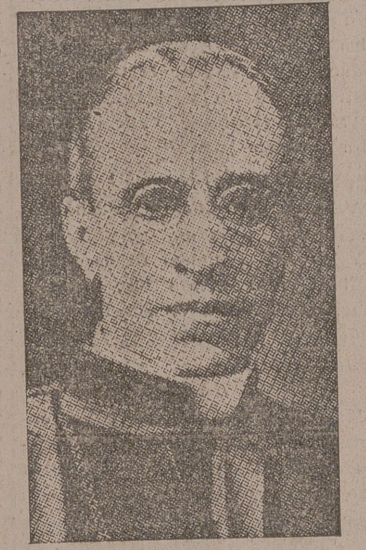
El Cardenal Eugenio Pacelli