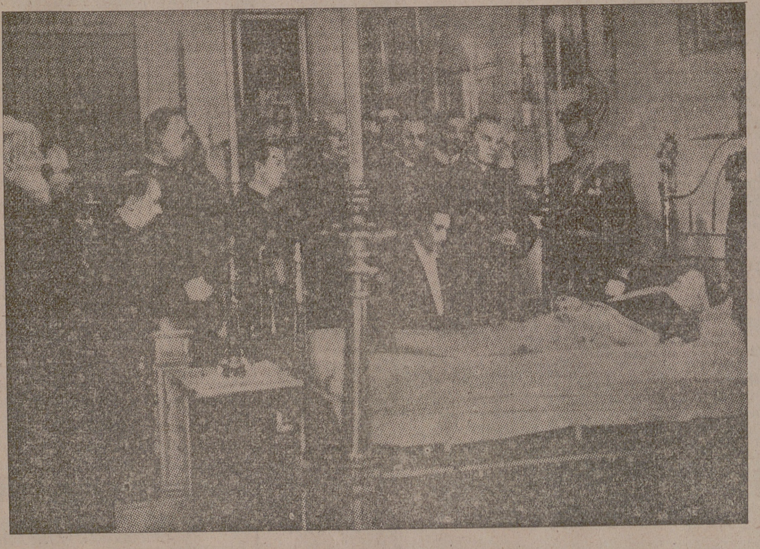
El Soberano Pontífice sobre el lecho de muerte

Ciudad del Vaticano, 13.—A pesar del mal tiempo una enorme muchedumbre, tan numerosa que era difícilmente encauzada por los servicios de orden, ha desfilado delante de los restos de Pío XI.