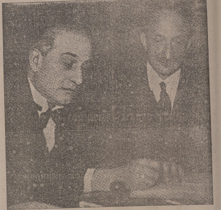
M. Pouritch, ministro de Yugoslavia en París, y Bonnet, en el momento de firmar el acuerdo

Agrega dicho comunicado que el señor Arita aseguró al embajador francés que esta ocupación tiene la finalidad de asegurar el bloqueo total de la China meridional y ac-