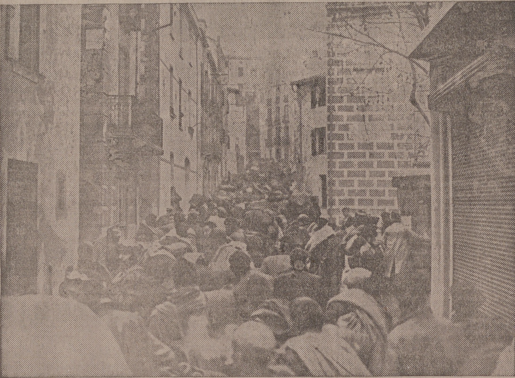
El exodo de las tropas rojas a territorio francés ha terminado: varias decenas de miles de milicianos se han refugiado en Francia.—Una de las calles del pueblo francés de Collioure completamente invadida por la multitud de los milicianos rojos huidos