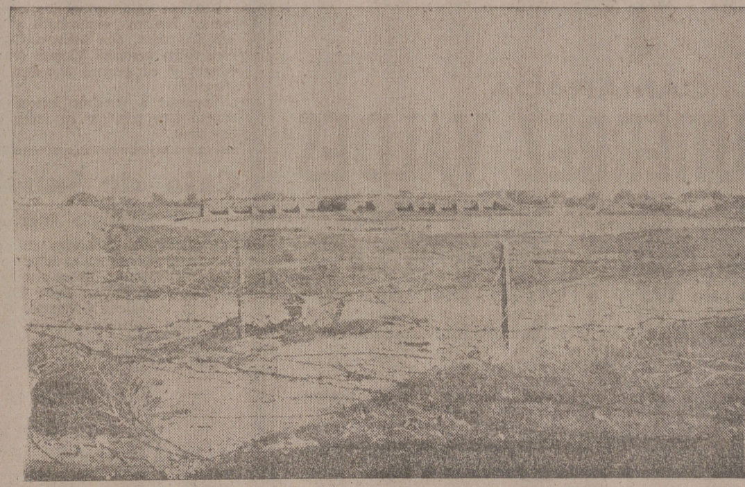
Las tres líneas fortificadas que defendían a Cataluña han sido completamente rebasadas por el Ejército del Generalísimo Franco, que avanza rápidamente hacia la línea defensiva de Barcelona, cuya construcción prosigue en los actuales momentos. - Vista parcial de un sistema de nidos de ametralladora en una de las líneas defensivas de Cataluña - la del sector de Cervera - conquistada por las tropas del Generalísimo Franco en los últimos días

Un mozo de Jaén, perteneciente al 249 batallón, locuaz y despedido, nos hace presente su firme creencia de que los marxistas no podrán ofrecer resistencia seria en lo que les resta de Cataluña. La irrefrenable ofensiva de