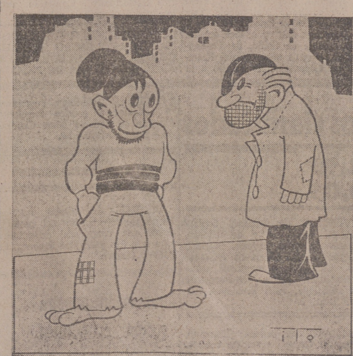
—Ya te dije yo siempre que los gobernantes huirían y aquí nos dejaban a nosotros solos.