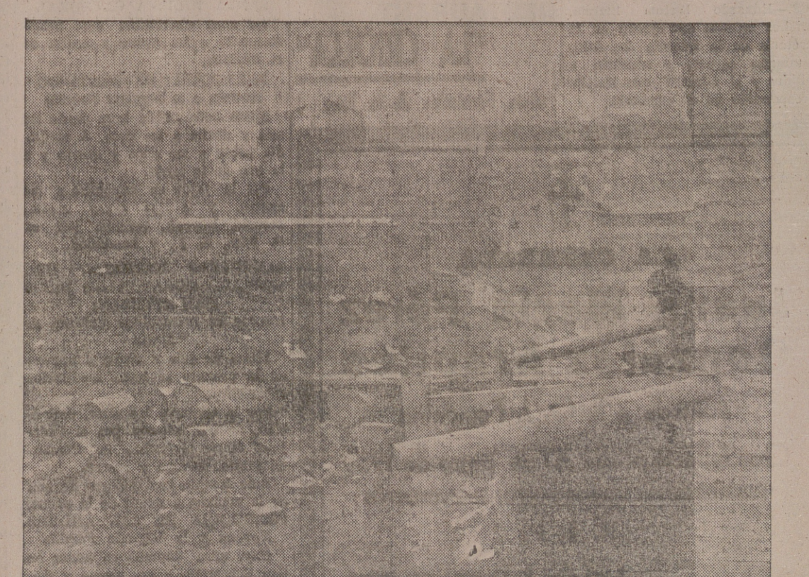
Desde mayo de 1938 el río Segre, que divide en dos porciones la ciudad de Lérida, ha venido constituyendo la línea de separación entre los dos Ejércitos enemigos. En los bordes del río y en las mismas calles de una y otra orillas los soldados de uno y otro Ejército hubieron de abrir fortificaciones y levantar alambradas. - He aquí las trincheras excavadas, en la orilla izquierda del río Segre, por las tropas del Gobierno Negrín y que han caído en poder de los soldados nacionales al pasar éstos el río con motivo de la actual ofensiva sobre Barcelona.

Por eso cuando después de enormes esfuerzos y de complejas medidas administrativas encaminadas a poner en marcha la organización estatal que ha de ejecutar la intervención directa de los precios, creen haber terminado con los desequilibrios de los mismos, podrán comprobar con dolorosa sorpresa que sólo se habrá conseguido retrasar el aumento en el nivel de vida de la Nación y, en último término, producir una escasez general de los artículos de consumo.