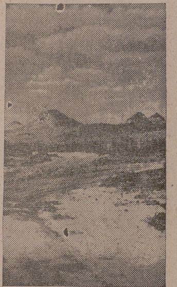
Es muy distinto ver los toros desde la barrera que intervenir en la corrida. El invierno también tiene "su aspecto" cuando se vive junto a una confortable chimenea y se ve nevar y llover detrás de un ventanal.

Los avances de ayer se hicieron con escasa resistencia del enemigo. Villanueva y Geltrú es la ciudad natal de Francisco Maciá, el finés personaie cuya obra no será nunca bien maldecida.