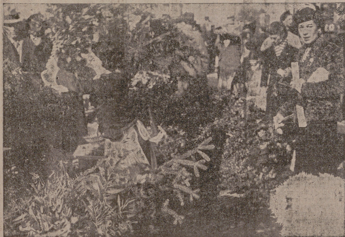
La venta de flores en las fiestas de Navidad, en Lisboa