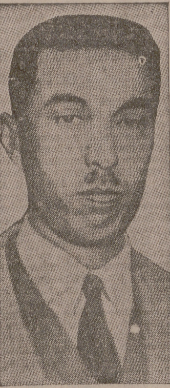
El príncipe Konoye, presidente dimisionario del Gobierno japonés