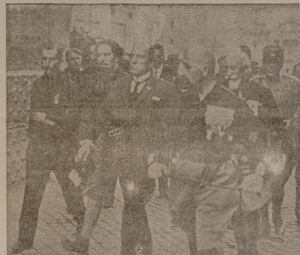
Hoy se cumplen dieciséis años de la marcha sobre Roma. En este tiempo Mussolini y sus colaboradores han conseguido que Italia, de una nación desarticulada, se convierta en un formidable Imperio. -En la foto se ve a Mussolini avanzando por las calles de Roma aquel día memorable

El Congreso se disuelve. Mussolini vuelve a Milán, desde donde dirige la acción. El Cuadrivirato se instala en Perugia. El 25 los comandantes de zona son convocados en Florencia, para recibir las últimas instrucciones. Al día siguiente llega al ministro Facta la invitación a dimitir. El 27 se proclama la movilización de los Fascios. La gran epopeya fascista está en su fase culminante. La movilización se efectúa con un fervor indescriptible. Desde Perugia el Cuadrivirato lanza una proclama a la Nación: "Hoy el Ejército de los Camiles Negros reafirma la victoria mutilada y, apuntando sobre Roma, la reconduce a la gloria del Capitolio. El Fascismo desvaneció su espada para cortar los demastados nudos gordianos que aprietan y sofocan la vida italiana. Invocamos al Sumo Dios y al espíritu de nuestros quinientos mil muertos como testigos de que un solo impulso nos mueve, una sola voluntad nos renne, una pasión sola nos inflama: contribuir a la salvación y a la grandeza de la Patria."