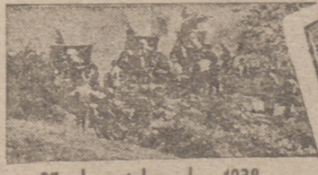
27 de octubre de 1938

Parte oficial de guerra del Cuartel General del Generalísimo correspondiente al día de hoy: En el frente de Madrid, durante la pasada noche, los rojos contraatacaron las posiciones últimamente conquistadas por nuestras tropas en el sector de la Cuesta de la Reina, siendo vigorosamente rechazados y causándoles gran número de bajas. Entre los cadáveres enemigos recogidos por nuestras fuerzas figuran cuatro oficiales. Es muy elevada la cantidad de fusiles, ametralladoras, municiones y granadas de mano cogidas a los rojos. En los demás frentes sin novedades dignas de mención. Salamanca, 27 de octubre de 1938.—III Año Triunfal.—De orden de S. E. el general jefe de Estado Mayor, FRANCISCO MARTIN MORENO.