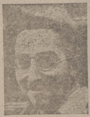
Más jefes de las brigadas internacionales de los rojos

trató de establecer una especie de servicio nacional y nuevas medidas para la militarización de varias Empresas. UN POBRE DISCURSO DE LLOYD GEORGE Londres, 27.—Aunque pronunció un discurso Lloyd George para América. Algunas estaciones de Norteamérica lo difundieron. Lloyd George declaró: "Hemos perdido el honor propio; hemos dejado destrozado a un pequeño país sin acudir en su ayuda." Se cree que en el Consejo se