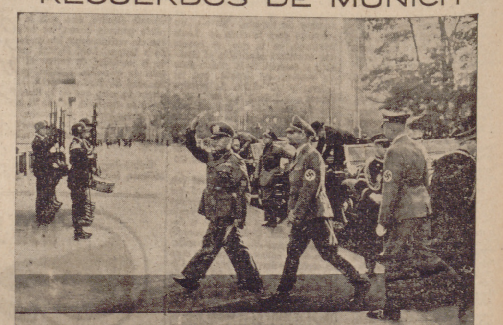
El Duce y Hess entrando en el palacio del Führer en Munich