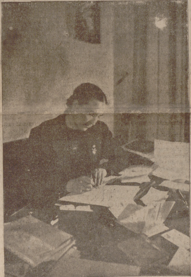
DE CASTILLA SURGIO UNA MUJER DE TEMPLE REDIO Y DE MIRADA AMPLIA. COMO SU TIERRA Y COMO SU CIELO. ESA MUJER CREO «AUXILIO SOCIAL». CUANDO ESPAÑA VE Y ADMIRA LOS FRUTOS DE UNA INSTITUCION QUE ES APOSTOLADO Y ES MILICIA, EL NOMBRE DE MERCEDES VA DE BOCA EN BOCA COMO UNA CANCIÓN DE PAZ QUE CANTARA EL SOLDADO EN TIEMPO DE GUERRA.