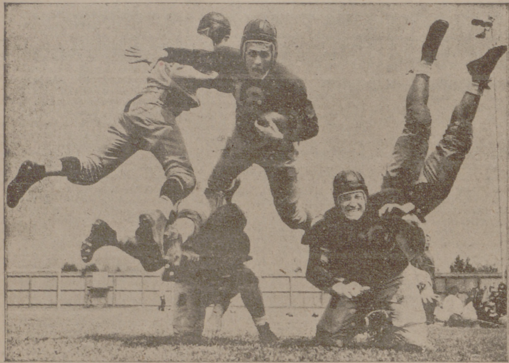
En un encuentro de rugby celebrado en Los Angeles por dos equipos de la Marina norteamericana, el "entusiasmo" de los respectivos defensores registró infinidad de escenas como la recogida en esta "foto"