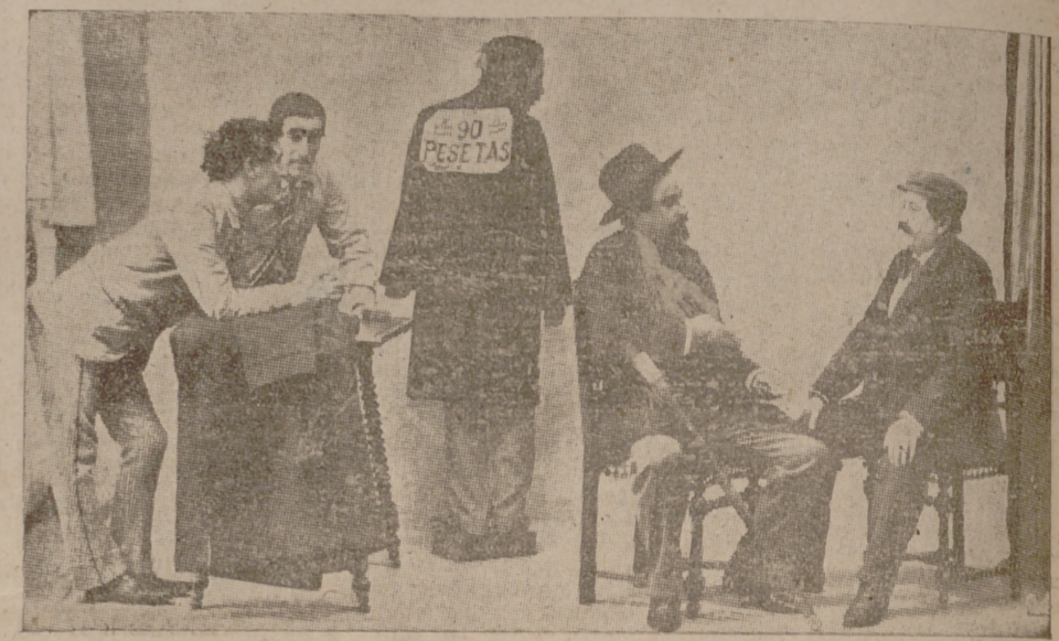
Una escena de "El terrible Pérez", humorada tragi-cómico-lírica en un acto, original de Carlos Arniches y Enrique García Alvarez, con música de Joaquín Valverde (hijo) y Tomás López, estrenada en el teatro Apolo de Madrid la noche del 1 de mayo de 1903. La fotografía corresponde al día del estreno