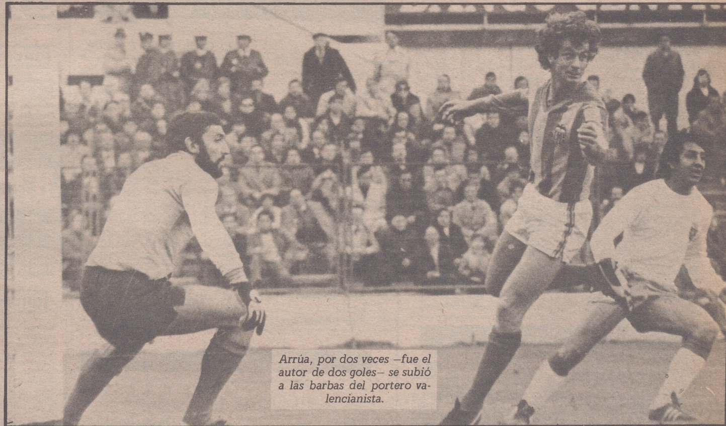
Arrúa, por dos veces —fue el autor de dos goles— se subió a las barbas del portero valencianista.