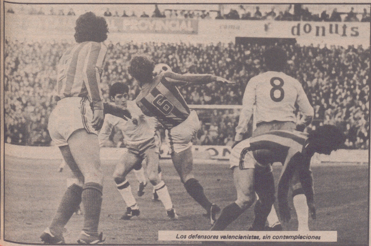
Los defensores valencianistas, sin contemplaciones