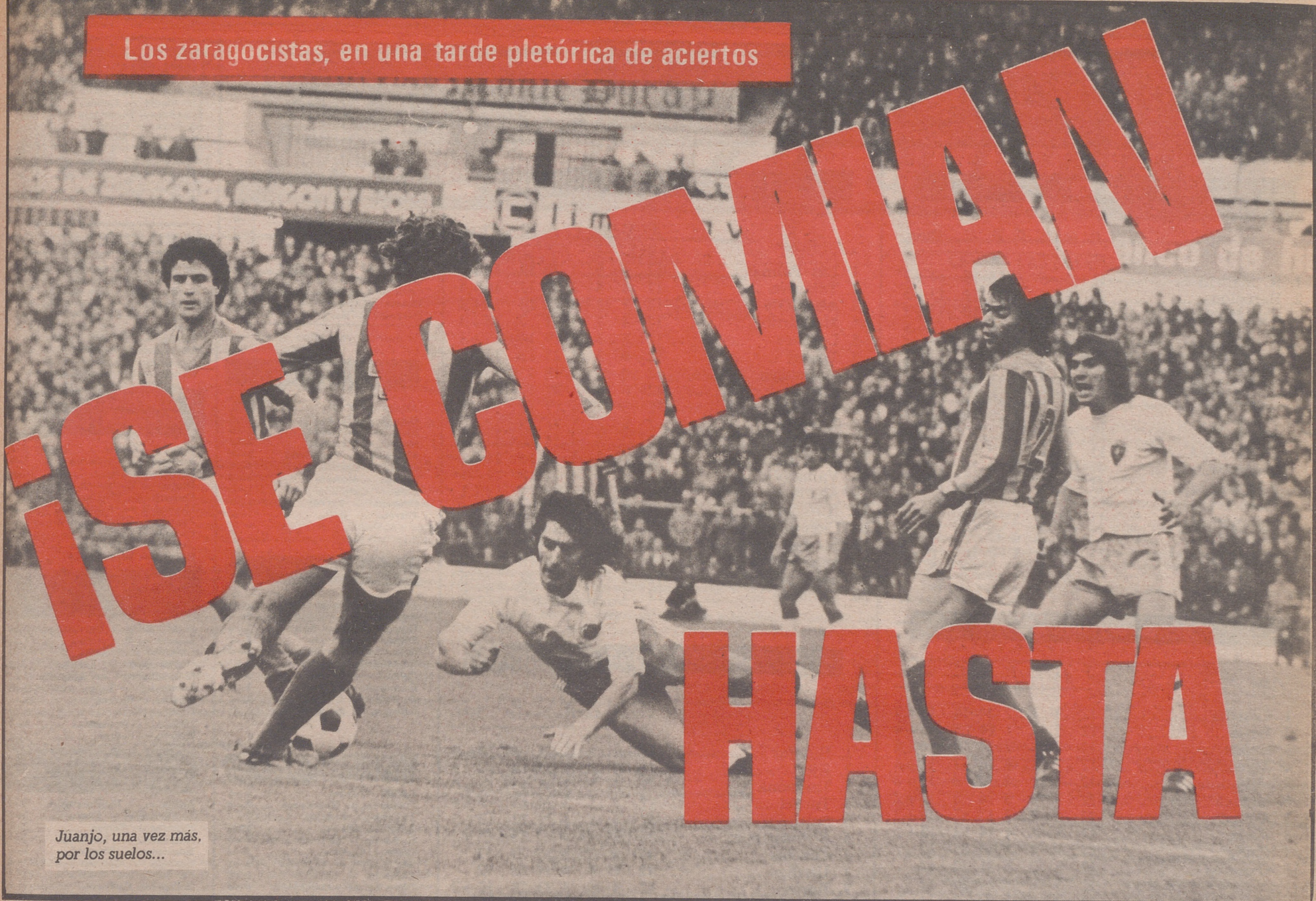
Juanjo, una vez más, por los suelos...

Los zaragocistas, en una tarde pletórica de aciertos