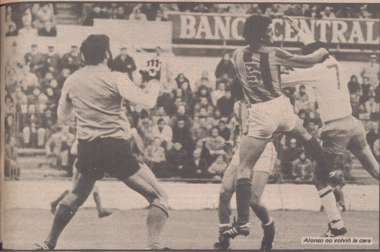
Alonso no volvió la cara