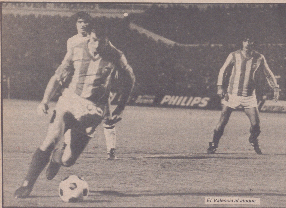
El Valencia al ataque

El caso es que jugaban más y mejor los "ches", pero aprovecharon y resolvían mejor los blanquillos. Así, cuando todos los espe-