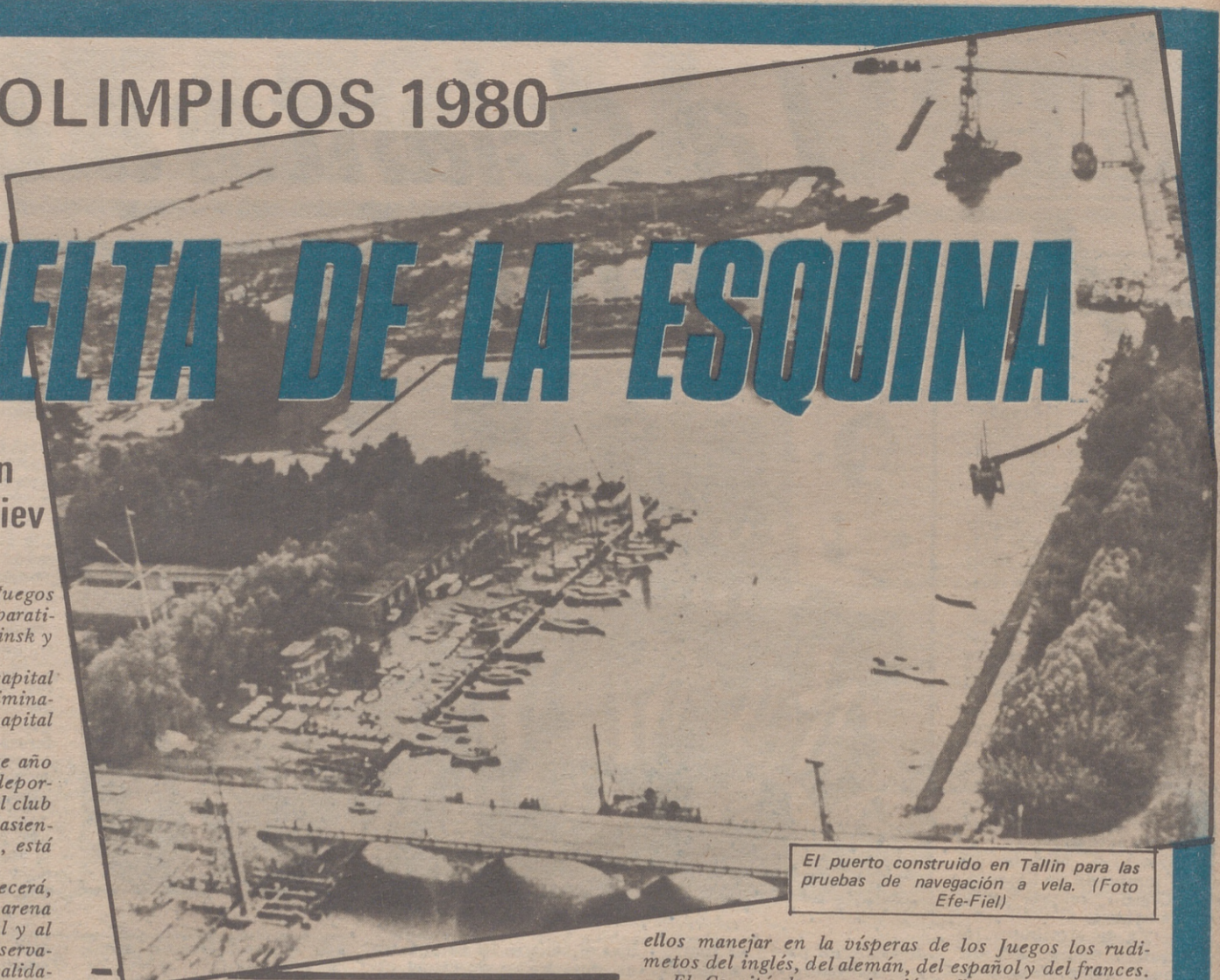
El puerto construido en Tallin para las pruebas de navegación a vela.

Los moscovitas piensan más bien en el apartamento que tal vez puedan obtener en la Villa Olímpica después de los Juegos. Equipados en parte por firmas extranjeras, los edificios de la Villa Olímpica se contarán entre las realizaciones más modernas de la capital.