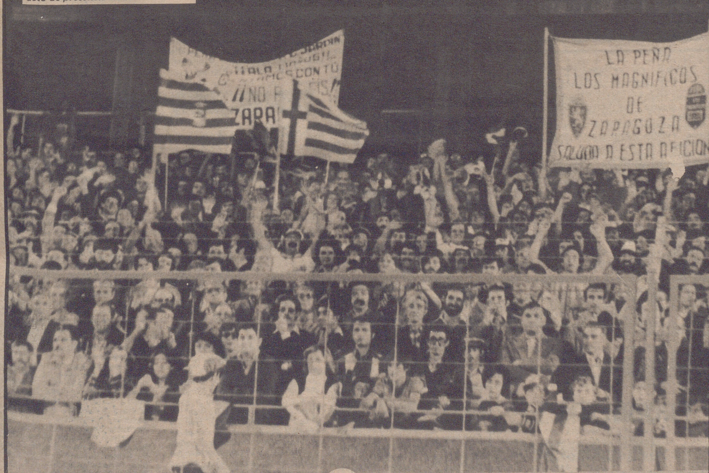
Los seguidores zaragocistas hicieron acto de presencia en Sarriá