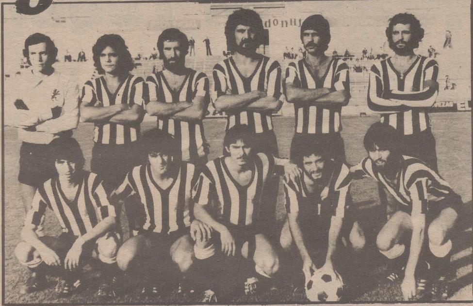
Toscal, el equipo fue ayer se enfrentó al Aragón

El primer tiempo del equipo local empezó bien, jugando con seguridad la defensa y dominando el centro del campo, especialmente por el extraordinario apoyo