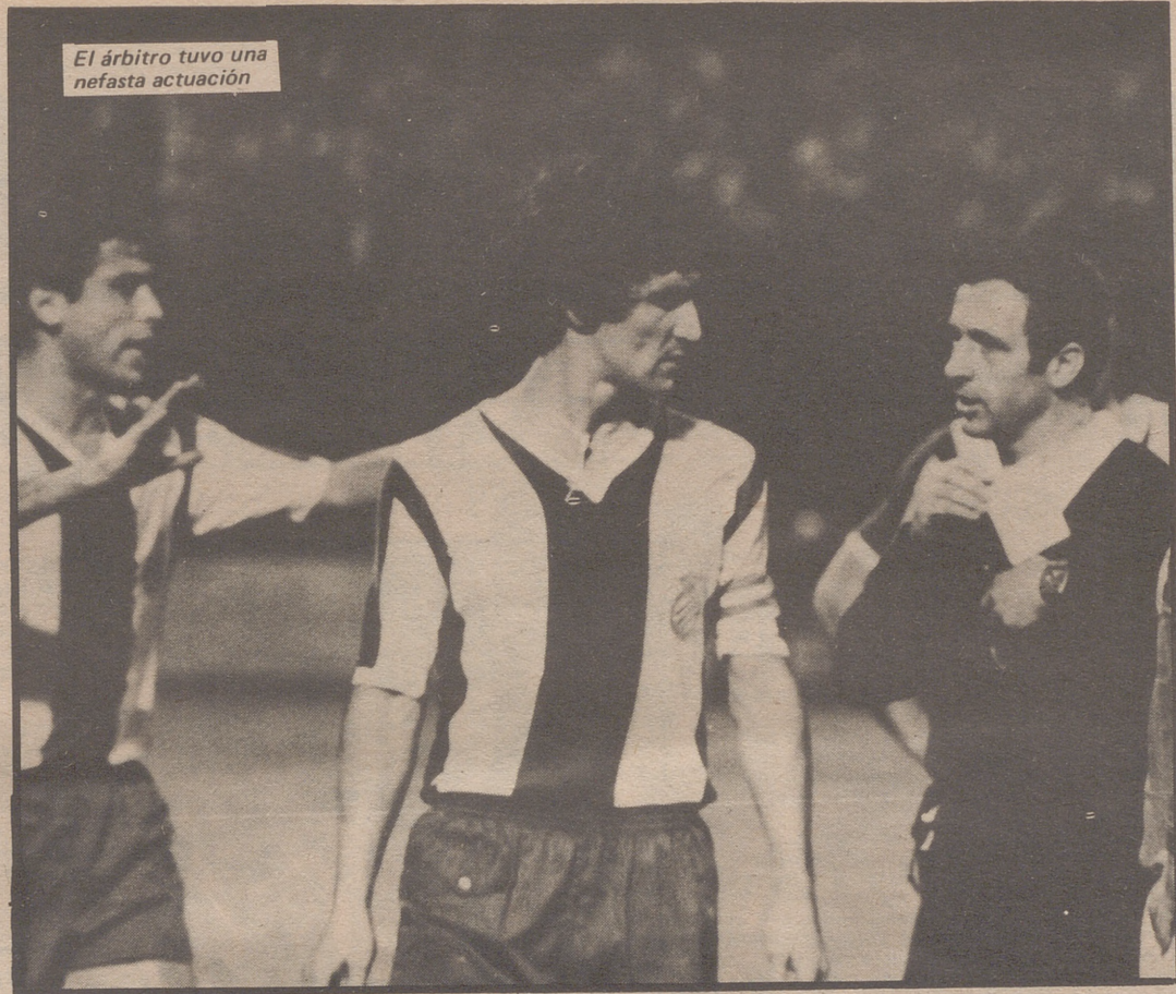
El árbitro tuvo una nefasta actuación