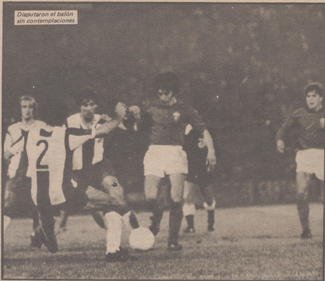
Disputaron el balón sin contemplaciones