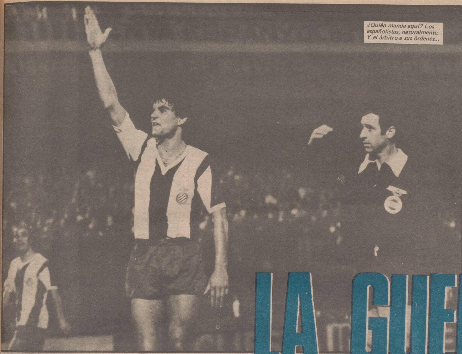
¿Quién manda aquí? Los españoles, naturalmente. Y el árbitro a sus órdenes...

u- arís ERTO JES L 3 años sin conce más profun humanas el pasaba ro de un y crudi ue le hizo discutido y n mucher canciones n público época de t Pierre" y el aplau o cuando mura del posiciones za lírica l'amour", tiene el e quitte ndones", unfo uni- sideró sa- o. Mante- a interior n un gran l que se mos años y crudi a en el y, en las Jacques existir, a 1, al serle el enfer- Brel em- n su vele- regresó a sta octu- De for- regresó ría su ú- reciente e había reto. El regresó a fatigado se en un origenes acido en ronizar a ; lo que tiempo iones en en paz. ntra to- a sí mis- odiarse no con- El autor ión que nos ha L. E. RO aseillo, r pese a ros de ero será úmero sureró, quillos. obrero da em- da. Las S ZA