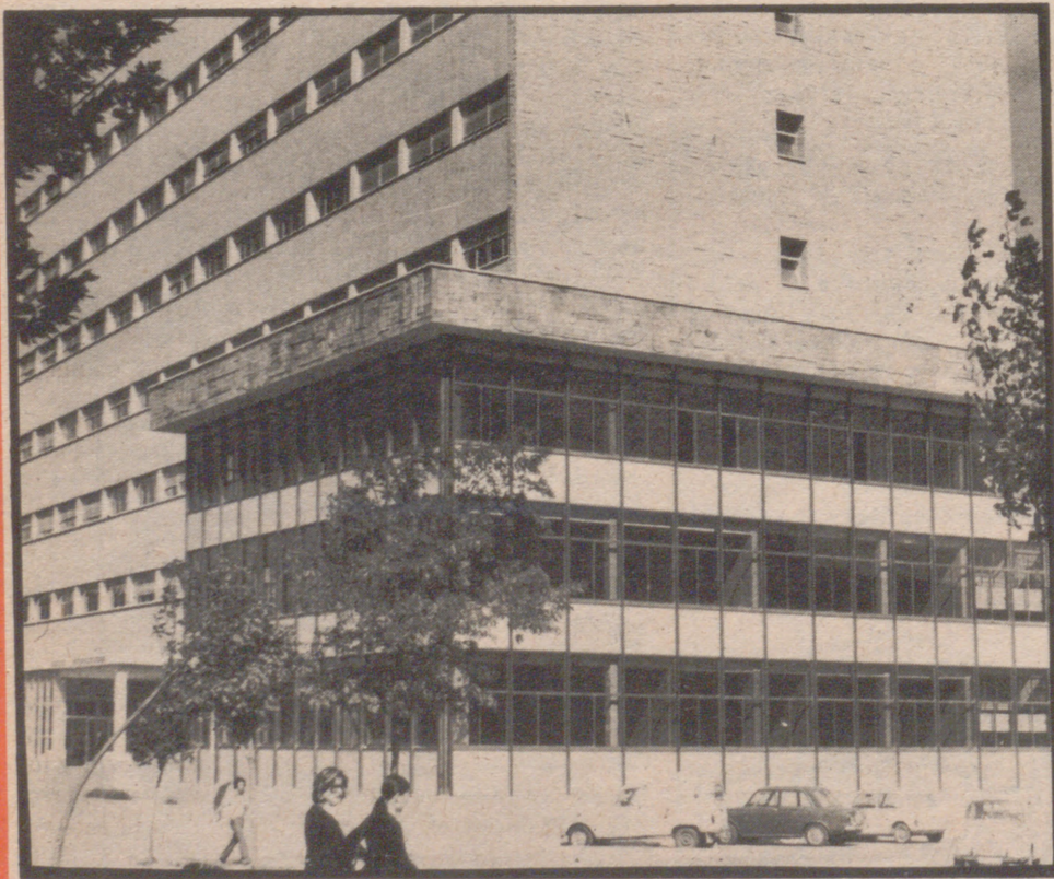
Se estudiará una ayuda mutua del Ayuntamiento y la Universidad

Zaragoza viva H La pro En el Sindicato han tenido tal han tenido del Comité E General de la reuniones en dicio las per cas por las q mía española empresarios acordado hac tualizaciones: 1.º Que la nacional par tir en el seg 1975. 2.º Que el energía hac teamiento de tivas, para coyuntura. 3.º Que, p realidad eco ticular y fo 4.º Que, e jetivos, tiene jugar, las ex cas. 5.º Que a desarrollo, n la problemá do, la incer adoptarse n las creditic el situación. 6.º Que n realidad de zación de la pufzas en b ha podido rrecimiento 7.º Que e stivos los pr den derivar trictiva que empresas, e dianas y a encontrarse rición, y r social que o disminu producirá. 8.º Que la capacid co de nue cuando nu son suficien tearán pro de modo tr Z A R A ("ARAGON/exprés" en el B. O. E. colocaron en los Universitaria, Cinco ZARAGOZA (pés)".— A la madrugada de accidente en el confluencia con de Venecia. El Z-3534-D cond Manuel Arias D con domicilio en a chocar contra se desconoce Fernando Diaz, VIERNES, 15 DE