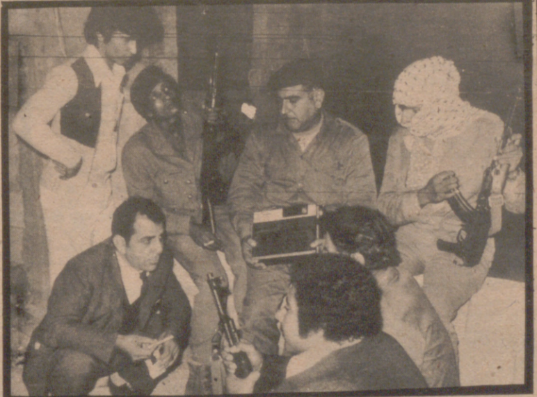
Imágenes de la presencia de Arafat en Nueva York y en La O.N.U.

propuesta del presidente, por 75 votos a favor 23 en contra y 18 abstenciones, a pesar de la fuerte oposición de los Estados Unidos e Israel.