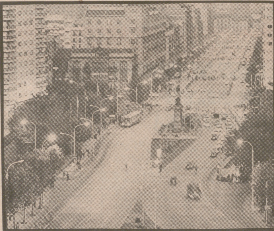
La Plaza de Aragón, un hecho consumado para el futuro.

Por lo demás, el recinto, prácticamente, será privado, y, en concreto, de una