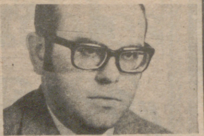
por Pedro CALVO HERNANDO

presentar en las Cortes la Ley de Carreteras— también se ha referido a la solidaridad con el programa del 12 de febrero. Y lo mismo ha hecho, en la Casa Sindical, el titular de comercio.