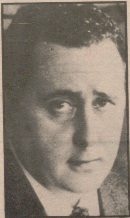
MADRID, 9 ("Europa Press").

«La única explicación posible del suceso es que tengan sus raíces y causas en factores extrínsecos a la voluntad gubernamental»