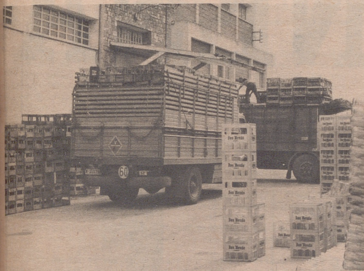
Las antiguas cajas de madera están siendo sustituidas por otras de plástico. Más cómodas, prácticas y llamativas.

EN ELLA SE ESTAN LLEVANDO A CABO VARIAS REFORMAS