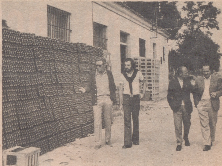
Cientos, miles de botellas apiladas y listas para encerrar el precioso líquido que es el vino de Cariñena.

Caminamos sobre millones de litros de vino. Bajo nuestros pies, en los depósitos, el líquido violáceo reposa. Muy pronto, la capacidad de estos depósitos será mucho mayor gracias a la instalación de unos nuevos de polieuretano. En estos momentos una grúa descarga las enormes vigas que servirán para sostener