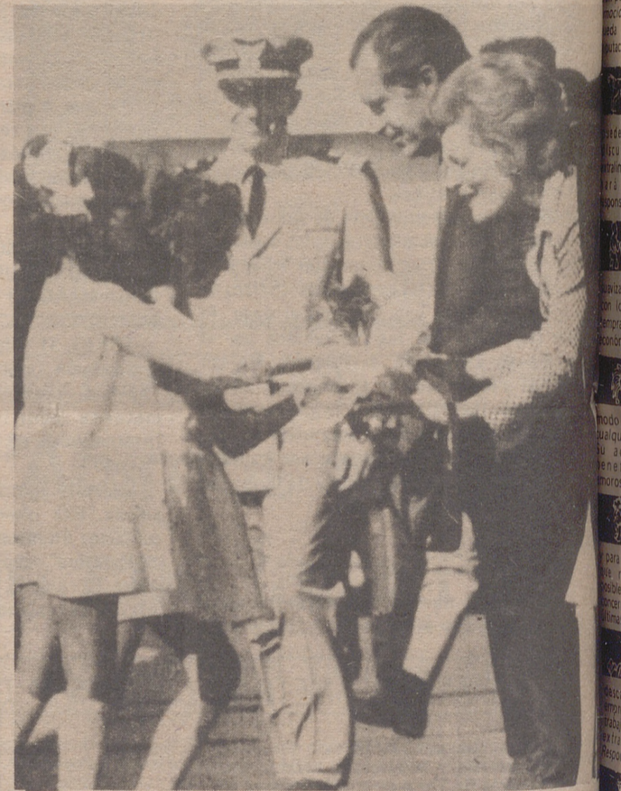
TEHERAN.— El presidente Nixon y su esposa, a su llegada a Teherán reciben ramos de flores de manos de dos niñas en el aeropuerto de la capital persa.— (Foto Ap-Europa Press)

Por la explosión, el general Price ha sufrido fractura de las piernas y otras heridas, su chofer, heridas no determinadas.