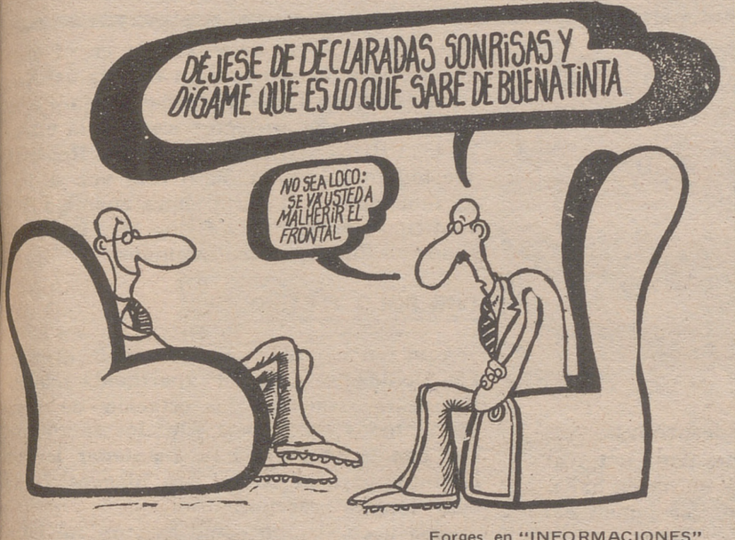
Forges, en "INFORMACIONES"

(Luis Caparrós, en «La Voz de Galicia»).