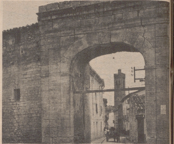
La puerta de Cariñena, que se conserva en perfectas condiciones

Precios correctos, trato amable y, sobre todo, una limpieza