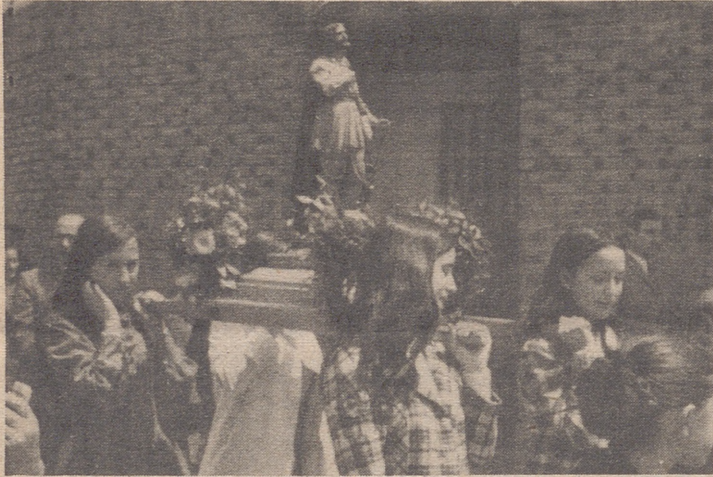
Un aspecto del traslado de la imagen de San Isidro, desde los locales de la Hermandad a la Iglesia Parroquial

Se hizo la tradicional ofrenda de frutos al Santo Patrón de los labradores