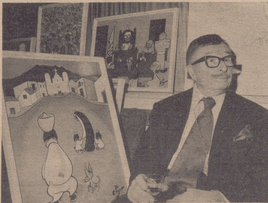
BARCELONA.— El famoso compositor y músico Xavier Cugat, aparte de su violín y su orquesta, tiene también una gran afición por la pintura, ahora para mostrar esta nueva faceta de sus dotes artísticas, expone en una sala barcelonesa una colección de sus pinturas y caricaturas.