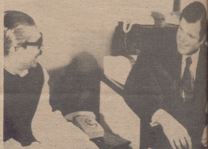
DACCA.— El Jeque Mujibur Rahman durante su entrevista con el senador norteamericano Edward Kennedy, a quien recibió en la residencia del primer ministro de Bangla Desh.