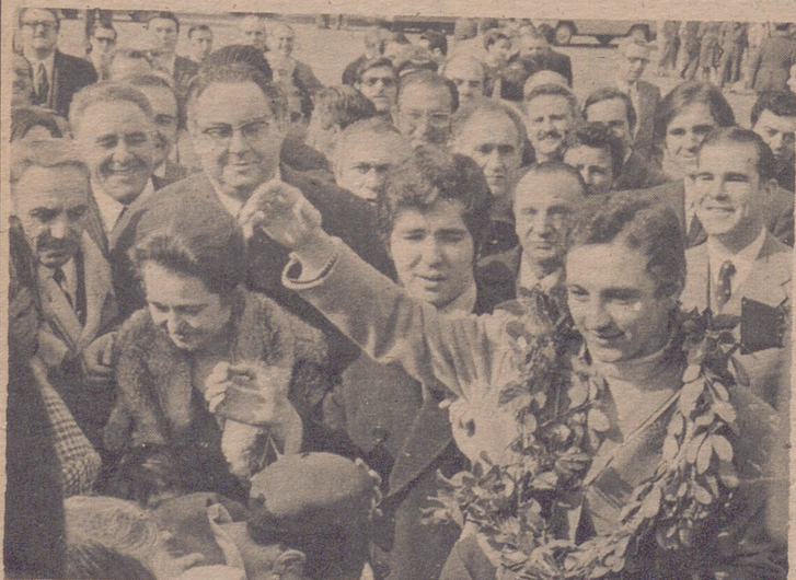
MADRID.- El campeón olímpico y medalla de oro de Sapporo Francisco Fernández Ochoa, a su llegada al aeropuerto de Barajas donde es esperado por sus padres, hermanos, delegado nacional de Educación Física y Deportes, federativos, y numerosísimo público.