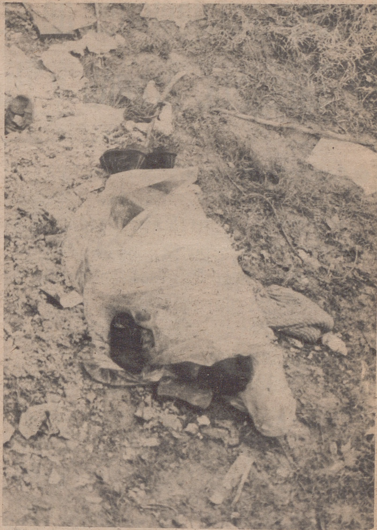
La cabecita y las botas del niño, asoman bajo el plástico con que lo han cubierto. El muchacho tenía seis años y era de nacionalidad norteamericana.

Los bomberos, los incansables hombres-rana, no han finalizado aquí su trabajo. Quedan aún entre las aguas del río, muchos cadáveres que recuperar, desde que el autobús que ahora permanece en el pozo de San Lázaro cayó al Ebro. Cuatro hombres han montado en una lancha y tras dar una vuelta más por donde el vehículo desapareció han seguido hasta Pina en busca de alguno de los viajeros perdidos.