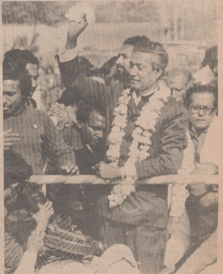
DACCA.— El jeque Mujibur Rahman es entusiastamente recibido por los bengalíes a su llegada al aeropuerto de Dacca, procedente de Nueva Delhi. (Foto Ap-Europa Press).