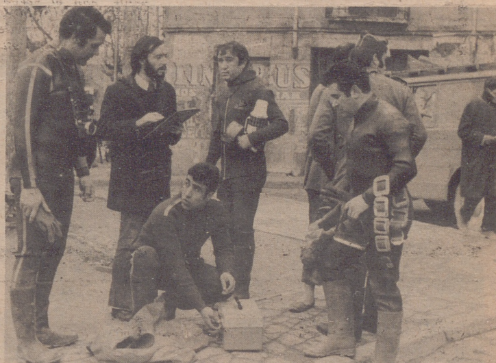
Tras el rescate del cuerpo del muchacho, el trabajo de los hombres rana no conoce descanso. Aquí los vemos preparándose para explorar el río hasta Pina, en busca de alguno de los desaparecidos en el accidente del autobús que cayó por el Puente de Piedra.