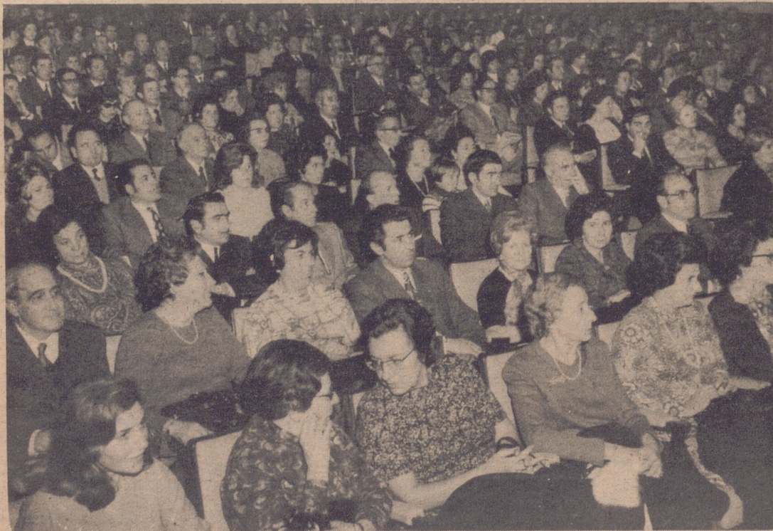
Aspecto del salón de actos de Cogullada

En las restantes representaciones de esta Caja de Ahorros de las tres provincias aragonesas y las de Rioja y Guadalupe se celebraron similares actos, con igual entusiasmo y espíritu de confraternidad.