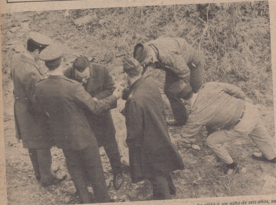
Toda la pena del mundo se refleja en el rostro de este súbdito norteamericano que ha visto a un niño de seis años, su hijo, muerto y lleno de barro.

El cadáver se ha encontrado esta mañana entre los puentes de Piedra y de Hierro