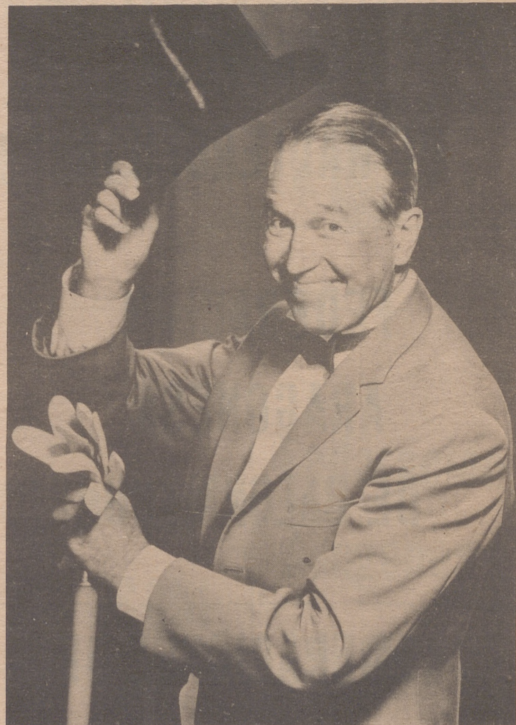
El sábado pasado fue el último sábado de Maurice Chevalier. Su eterna sonrisa-Chevalier era, sobre todo, eso, una sonrisa que se le paraba el corazón, quizás ya consumido de haberlo dejado en cada escenario, en cada rincón del mundo.

París ha perdido a su último "chansonier" y, el mundo, al más radiante superviviente de una época frívola y canceante, amable y feliz.