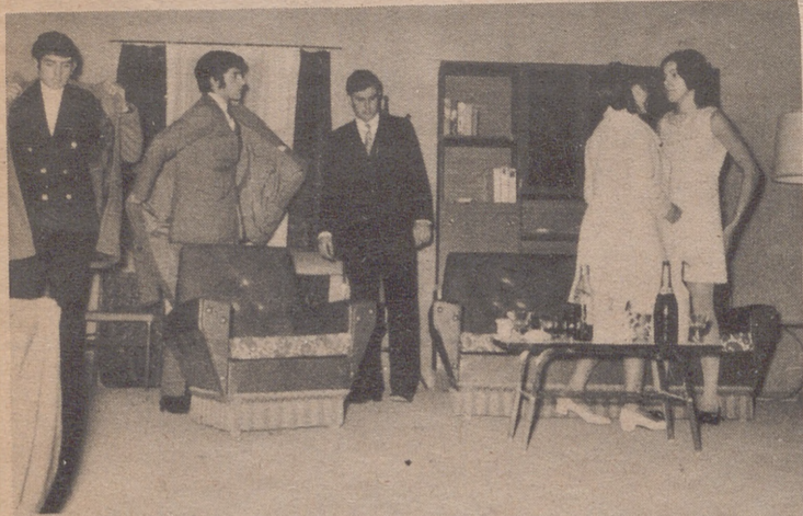
El grupo de Teatro "Graus 1970" en "El cuervo de Alfonso Sastre"

Por dificultades técnicas, no podrá representar la obra "La Anunciación a María", programada para el martes.