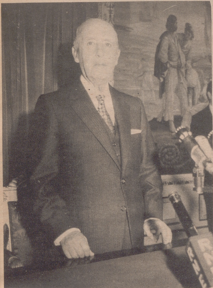
MADRID.— Su Excelencia el Jefe del Estado Generalísimo Franco dirige a los españoles el tradicional mensaje de Fin de Año.