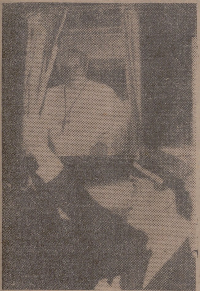
ROMA. — Su Santidad el Papa, Juan XXIII, ha salido hacia el Santuario de Nuestra Señora de Loreto, en representación de los demás santuarios del mundo. En la foto le vemos en la ventanilla del tren impartiendo su bendición.