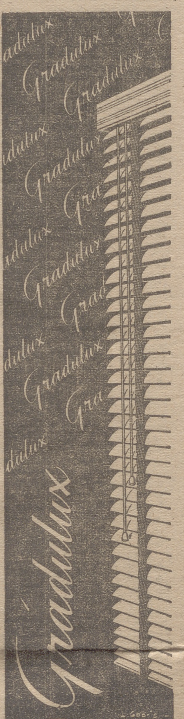
ES LA AUTENTICA PERSIANA AMERICANA QUE SE FABRICA EN ESPAÑA

Ellos mismos se acusan. Se acusan ellos mismos con la cruzada y con el triunfo propio de los ladrones cuando no se avienen al reparto del despojo, ni mucho menos, la rebatida del último mendrugo.