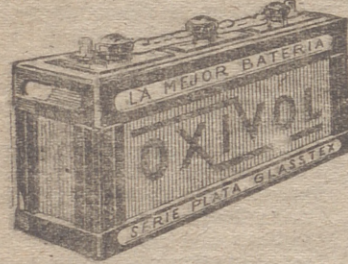
LA MEJOR BATERIA OXIVOL