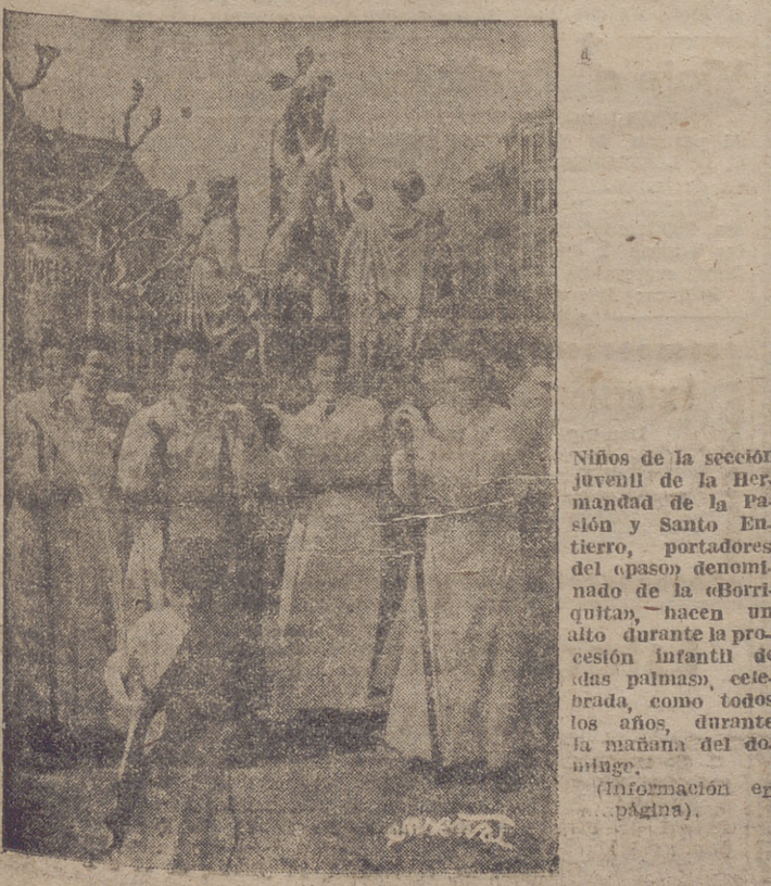
Niños de la sección juvenil de la Hermandad de la Pasión y Santo Entierro, portadores del pasivo denominado de la «Borriquita», hacen un alto durante la procesión infantil de las palmas, celebrada, como todos los años, durante la mañana del Domingo. (Información en página 2.)