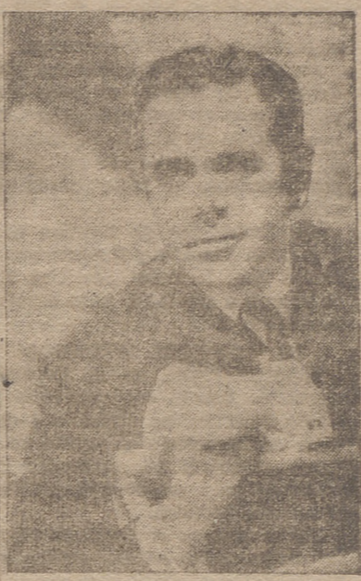
—'Tengo cuatro días para estar en Madrid...'