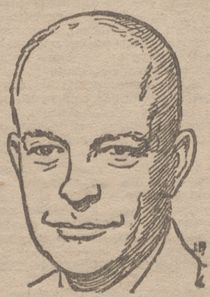
TRUMAN LE FELICITA Y LE OFRECE EL AVION PARA SU ANUNCIADO VIAJE A COREA